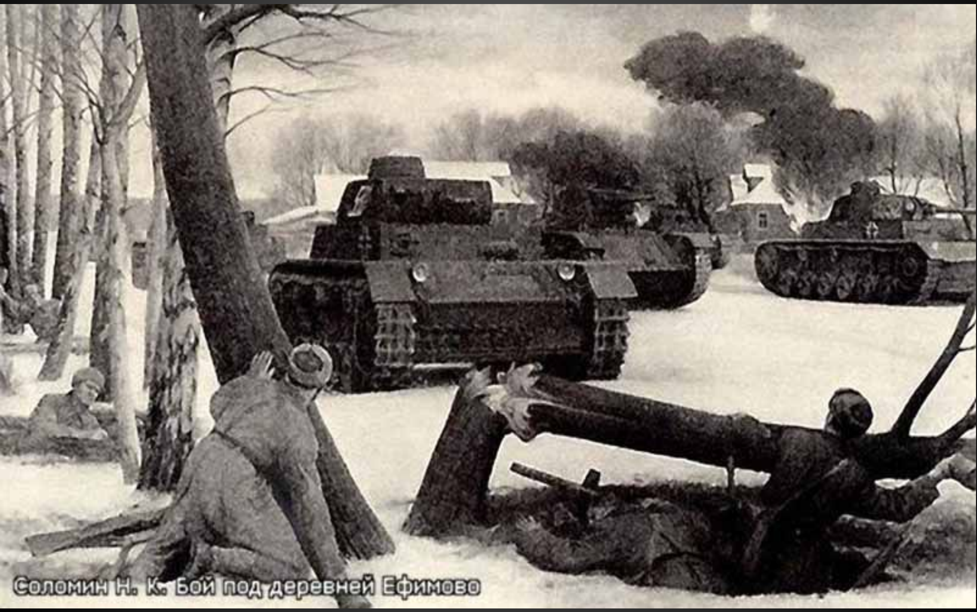
Соломин Н. К. Бой под деревней Ефимово