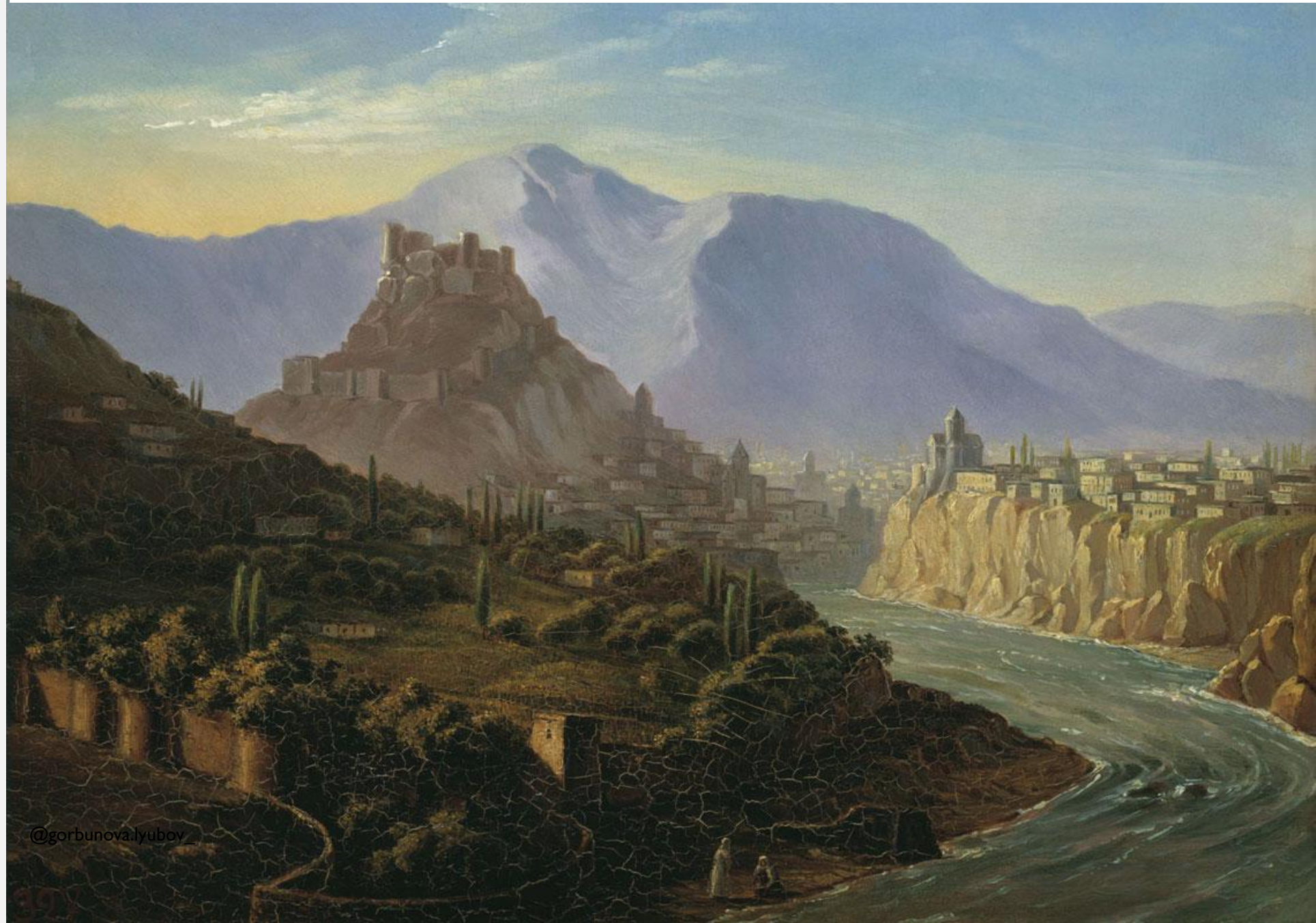
М.Ю. Лермонтов. Вид Тифлиса.