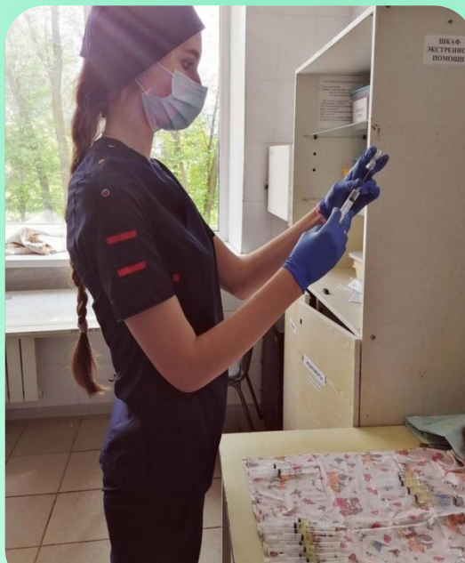
Рис.8. Набор противовоспалительного препарата