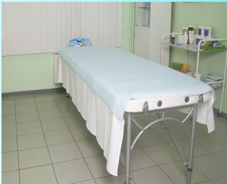
Рис.13. Кабинет массажа