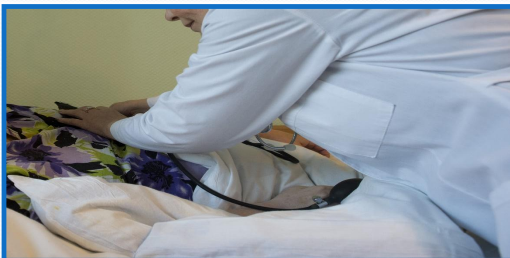
Рис.7.Оценка состояния пациента

V этап – оценка результатов перечисленных этапов, позволяет повысить качество сестринской помощи.