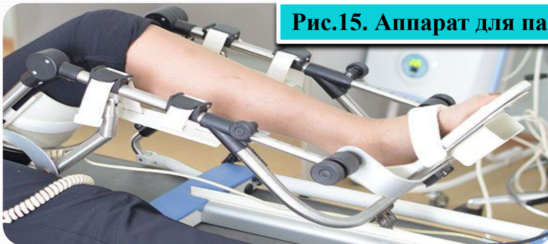
Рис.15. Аппарат для пассивной разработки суставов