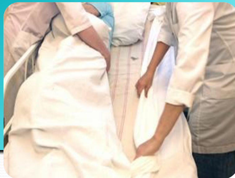
Рис.12. Смена постельного белья