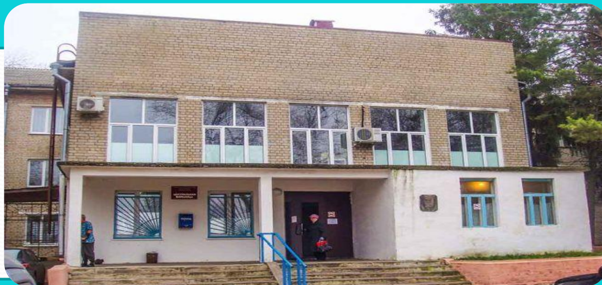
Рис.5. Мценская центральная районная больница

Высококвалифицированный медицинский персонал Мценской центральной районной больнице имеет огромный опыт в лечение заболеваний различной этиологии. К которым относится заболевания суставов. Пациентов с данным заболеванием в Мценской центральной районной больнице размещают в травматологическом отделении.