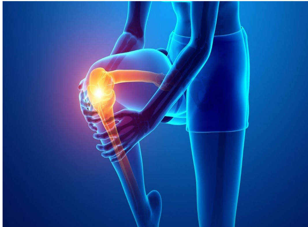
Рис.4. Воспаление сустава.