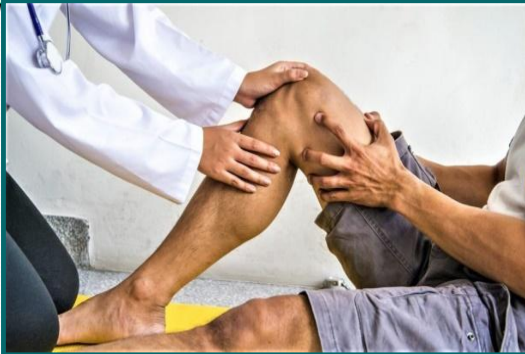
Рис.2. Боль в суставе.

Боль в суставах — распространенный симптом, сопровождается болезненными ощущениями, развивается при заболеваниях опорно-двигательного аппарата. Встречается у 50 % населения. Проблемы чаще начинаются после 45 лет.