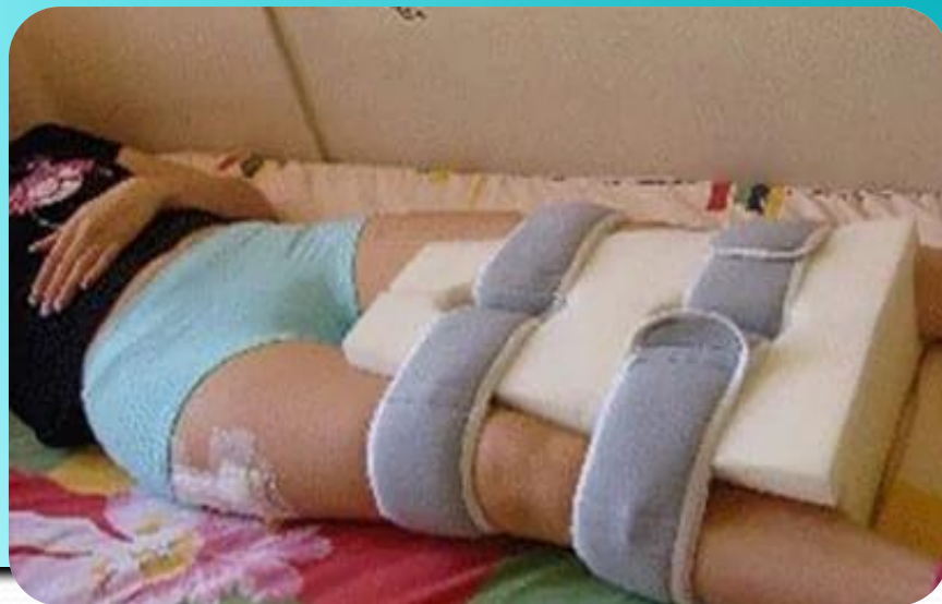
Рис.11. Фиксация суставов