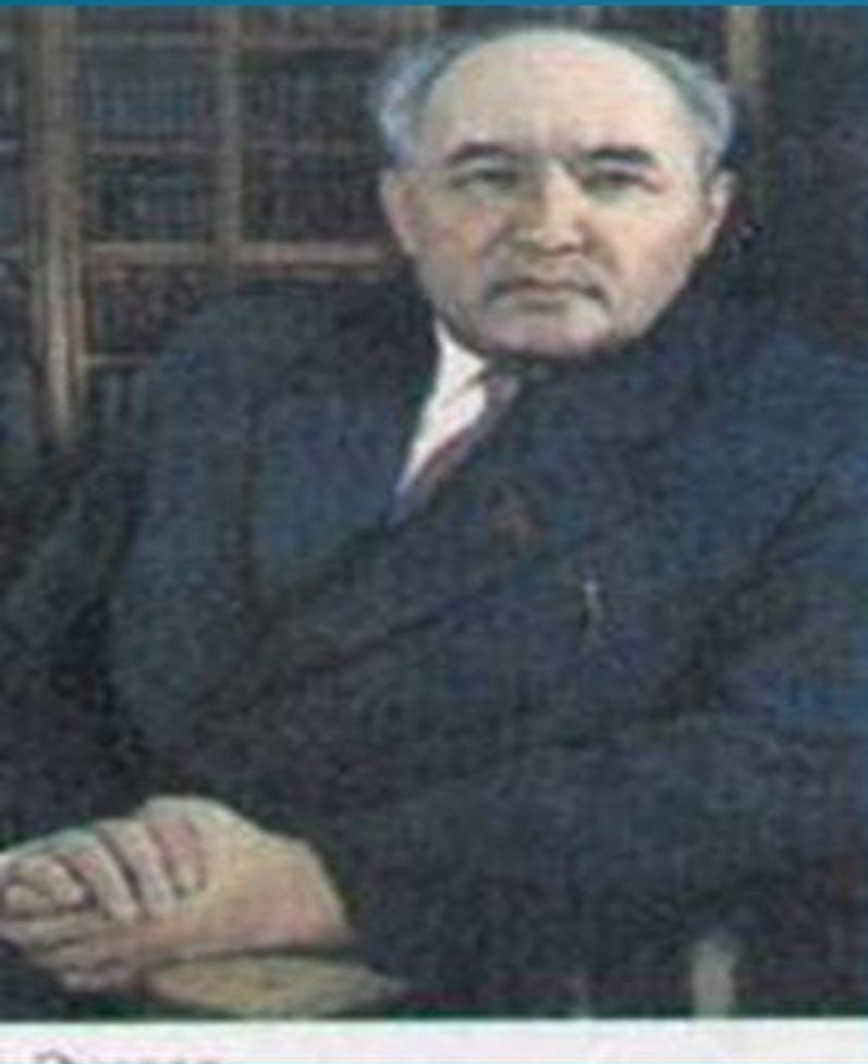
Әуезов Мұхтар Омарханұлы (1897-1961)

«Абай жолы» - Мұхтар Әуезовтың әлемге әйгілі тарихи романдар топтамасы - қазақтың тұңғыш эпопеясы. 1-кітабы 1942, 2-сі 1947, 3-сі 1952, 4-томы 1956 ж. жарыққа шықты. «Абай жолы» арқылы қазіргі қазақ прозасы күллі дүние жүзі әдеби классиканың шырқау шыңына шықты. Сөйтіп, 19 ғасырдың 40-50-жылдарын М. О. Әуезов туған әдебиетіміздің даму тарихында бұрын-соңды болып көрмеген ренессансқа айналдырды. Мұның өзі заңды да, өйткені «Абайдай» шығарма бұл тұсқа дейін қазақ әдебиетінде болған емес».