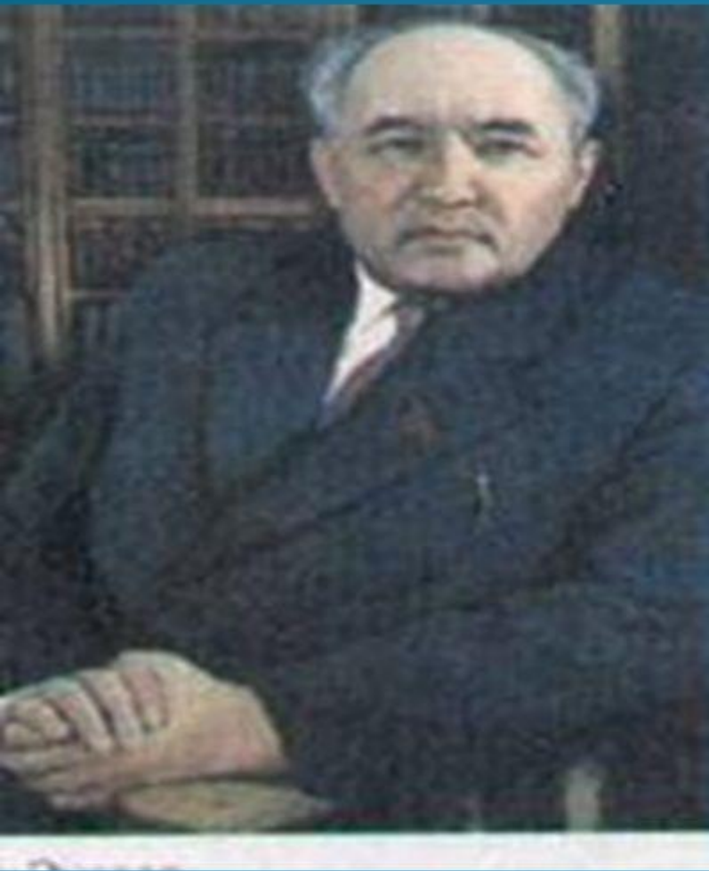
Әуезов Мұхтар Омарханұлы (1897-1961)

«Абай жолы» - Мұхтар Әуезовтың әлемге әйгілі тарихи романдар топтамасы - қазақтың тұңғыш эпопеясы. 1-кітабы 1942, 2-сі 1947, 3-сі 1952, 4-томы 1956 ж. жарыққа шықты. «Абай жолы» арқылы қазіргі қазақ прозасы күллі дүние жүзі әдеби классиканың шырқау шыңына шықты. Сөйтіп, 19 ғасырдың 40-50-жылдарын М. О. Әуезов туған әдебиетіміздің даму тарихында бұрын-соңды болып көрмеген ренессансқа айналдырды. Мұның өзі заңды да, өйткені «Абайдай» шығарма бұл тұсқа дейін қазақ әдебиетінде болған емес».