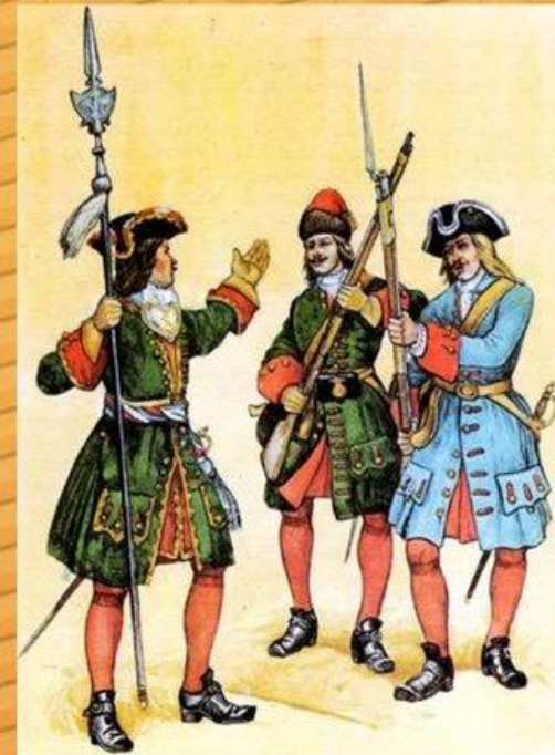
Гвардейцы Преображенского(синего цвета) и Семеновского(зеленого) полков при Петре I

Пётр проявлял большой интерес к религии и наукам, с удовольствием обучался военной премудрости. С 1683 года в селе Преображенском под Москвой юный царь образовал «потешные полки». «Воины» - сверстники царя из семей придворных и окрестная детвора – были одеты в настоящую военную форму. «Потешные полки» стали прототипом новой российской армии, которая была создана по европейским стандартам.