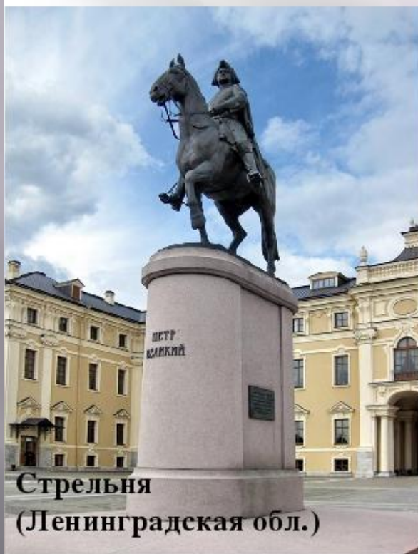
Стрельня (Ленинградская обл.)

Личность Петра, его реформы и достижения оставили неизгладимый след в истории России и всего человечества.