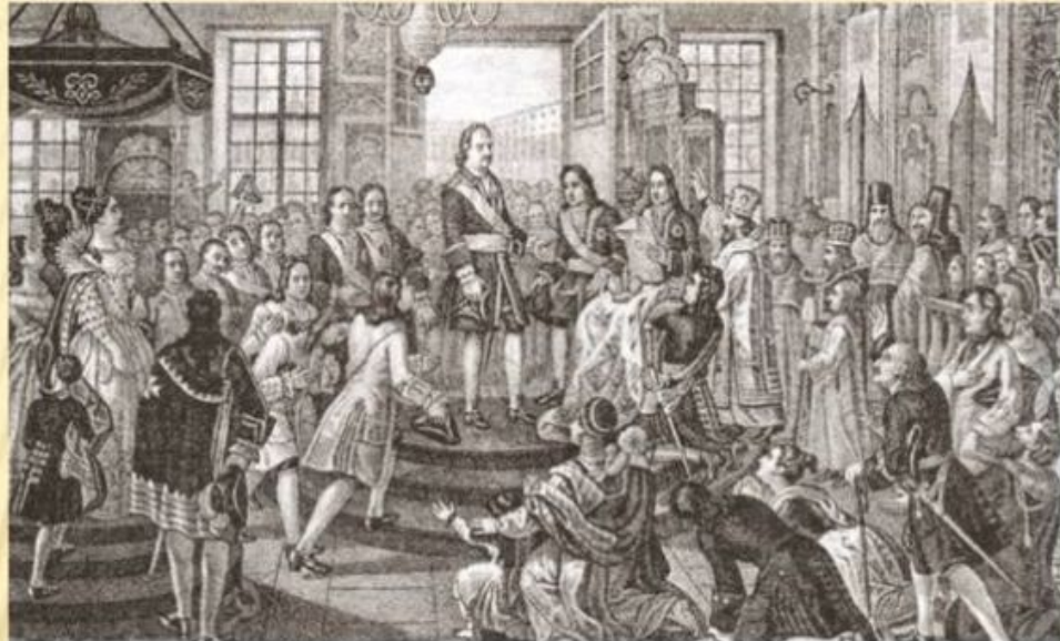
Царь Пётр I принимает титул Отца Отечества, Императора Всероссийского, 1721 год.

После победы в Великой Северной войне, которая позволила расширить территории России в Прибалтийском регионе, Петр I по прошению сенаторов принял титул Отца Отечества, Императора Всероссийского, Петра Великого в 1721 году.