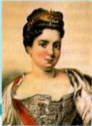
Екатерина – жена