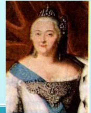
Елизавета – дочь