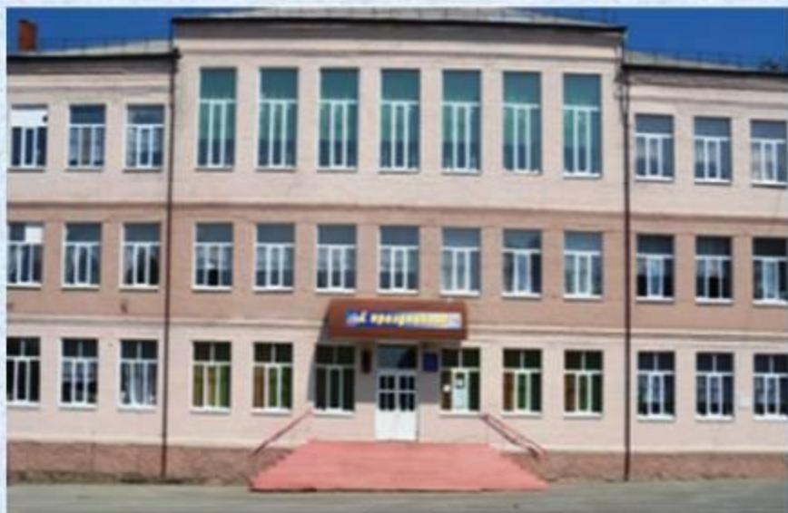
МБОУ – СОШ № 3 им. С. Орджоникидзе