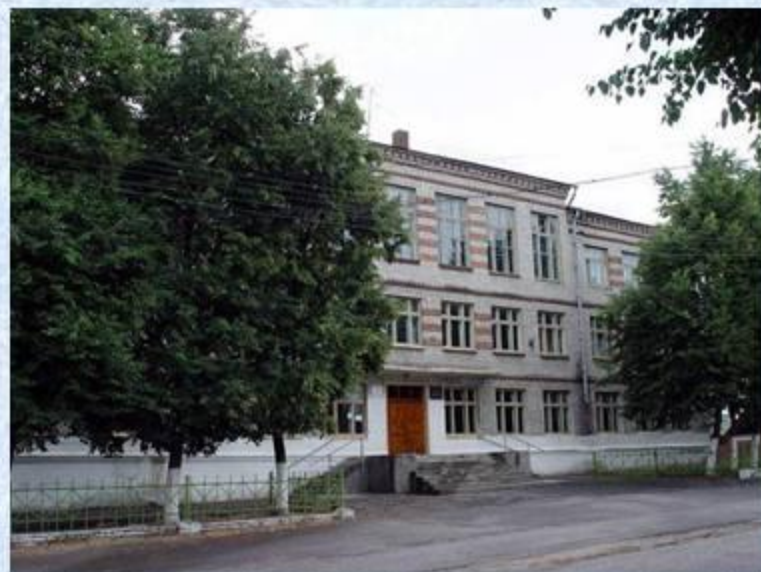
МБОУ – СОШ № 6 им. Коновалова В. П.