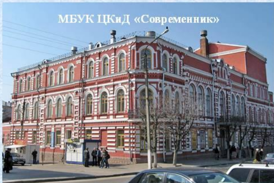
МБУК ЦКиД «Современник»