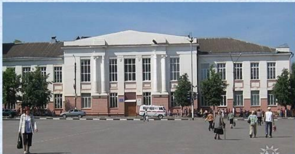
МБОУ – СОШ № 2 им. А. И. Герцена