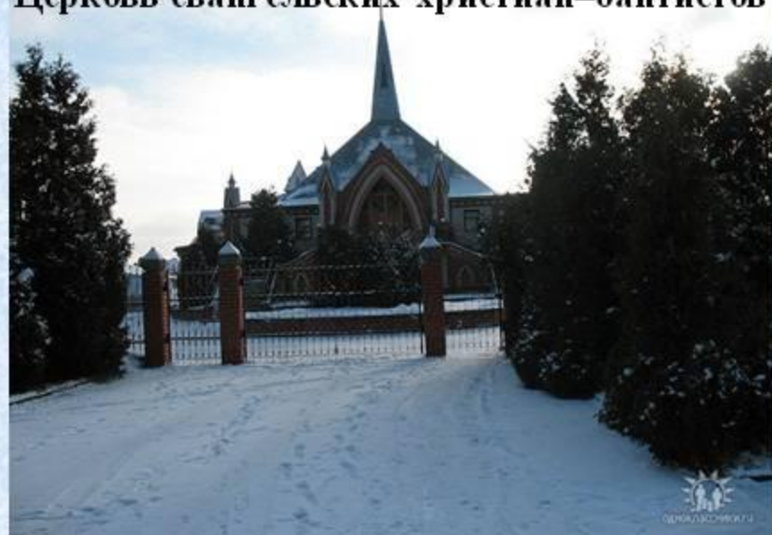
Церковь евангельских христиан-баптистов