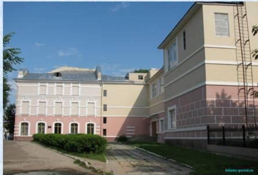
ДЮСШ им. В. И. Шкурного