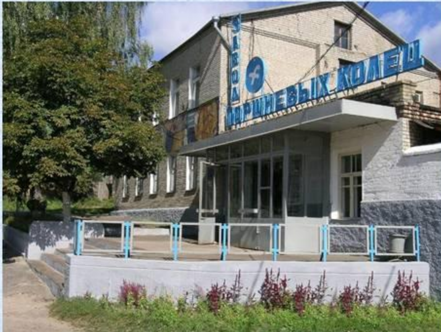
ОАО «Клинцовский завод поршневых колец»