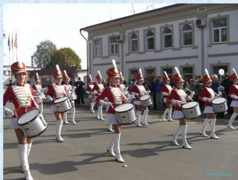
КАЗ отмечает 80 – летие