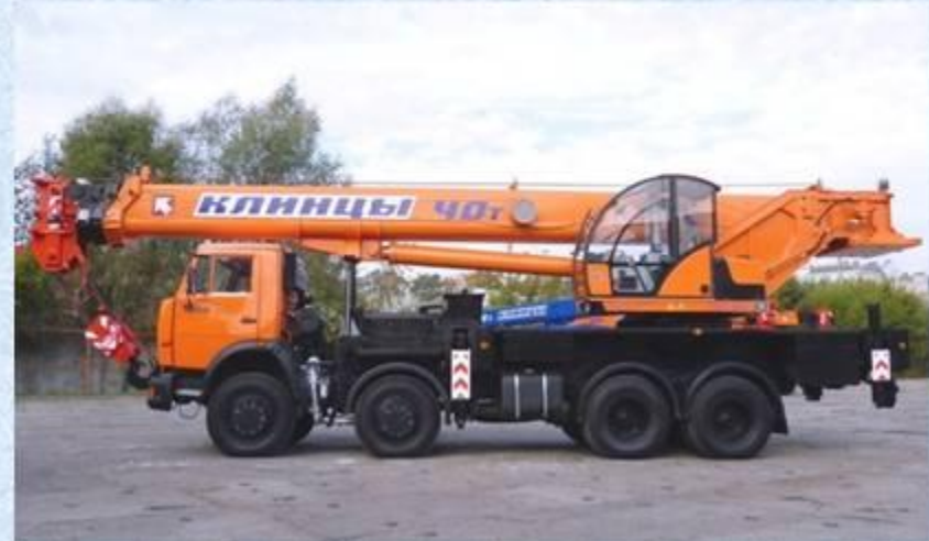
Современный кран ОАО «КАЗ»