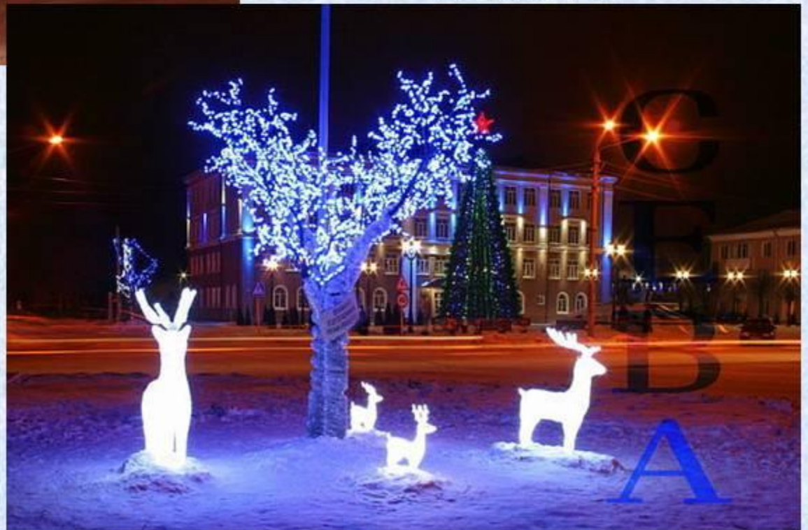
Площадь им. Ленина