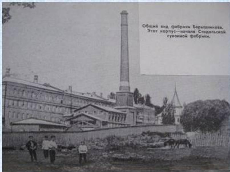
Фабрика Барышникова (бывшая им. В. И. Ленина)

С 1830 – х годов в Клинцах появляется текстильное производство, постепенно ставшее важнейшей отраслью промышленности города.