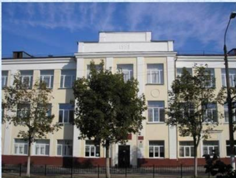
МБОУ – Гимназия № 1 им. Ю. А. Гагарина