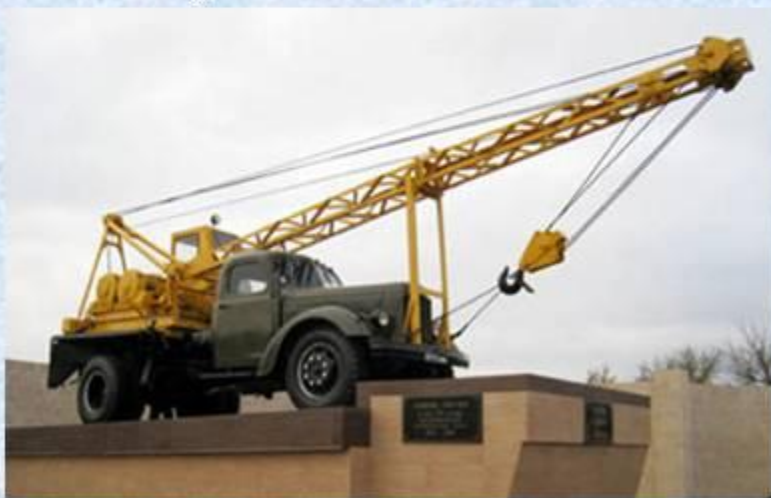
Первый кран Завода им. Н. А. Щорса