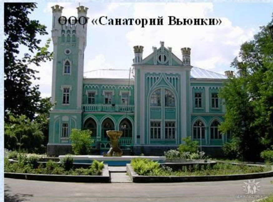
ООО «Санаторий Вьюнки»