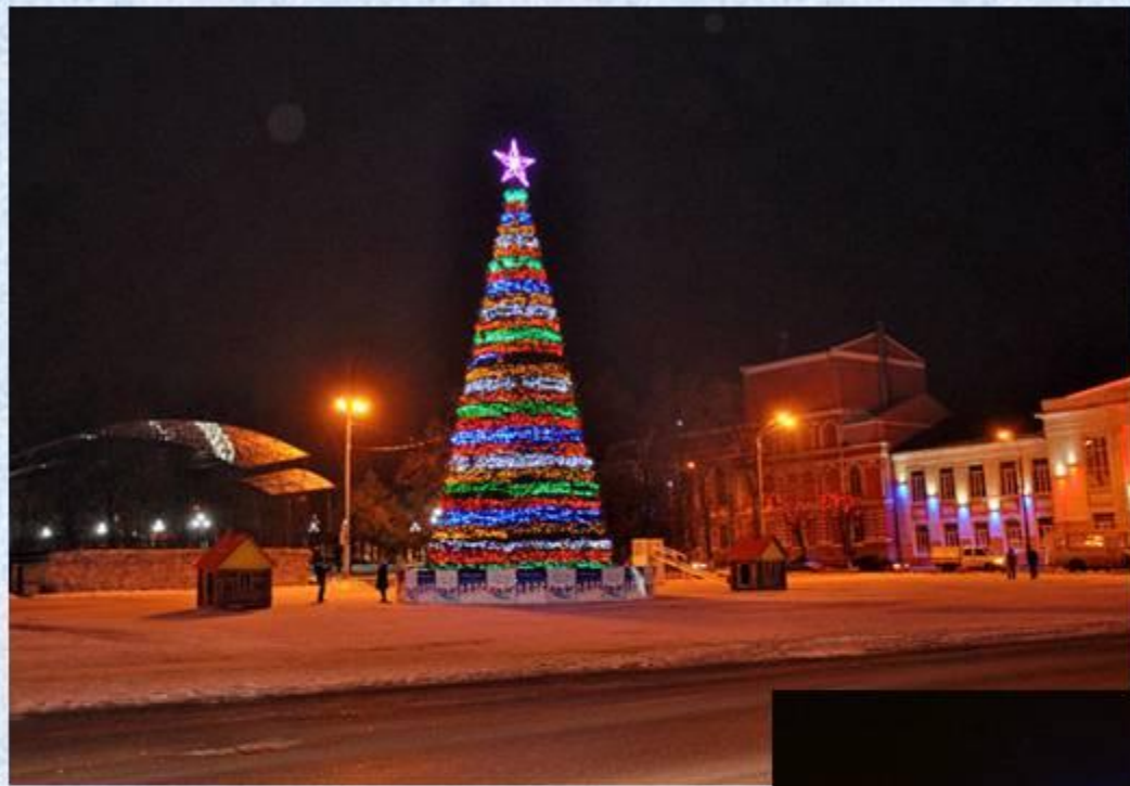
Площадь 50 летия Октября