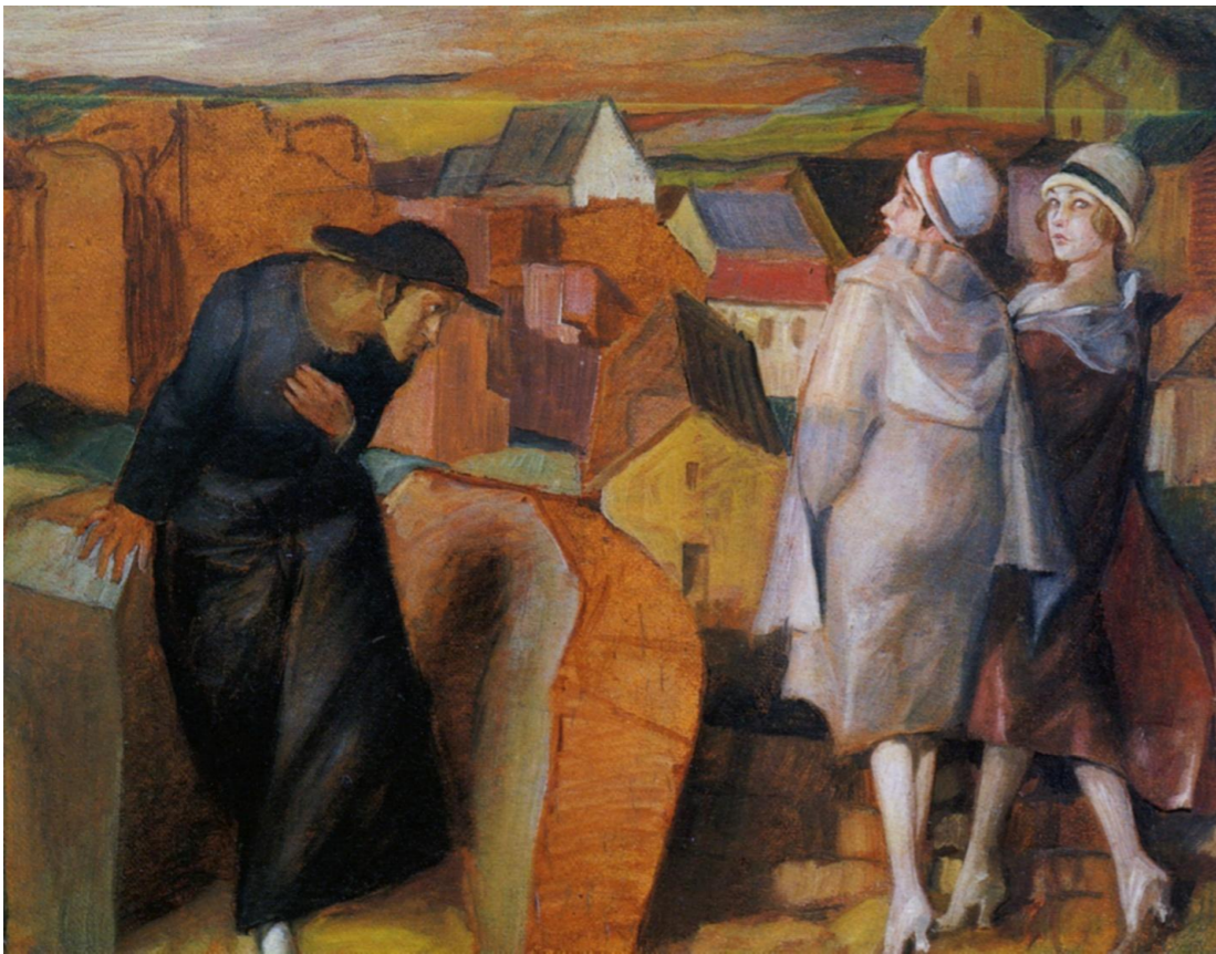
Bruno Schulz Spotkanie , 1920