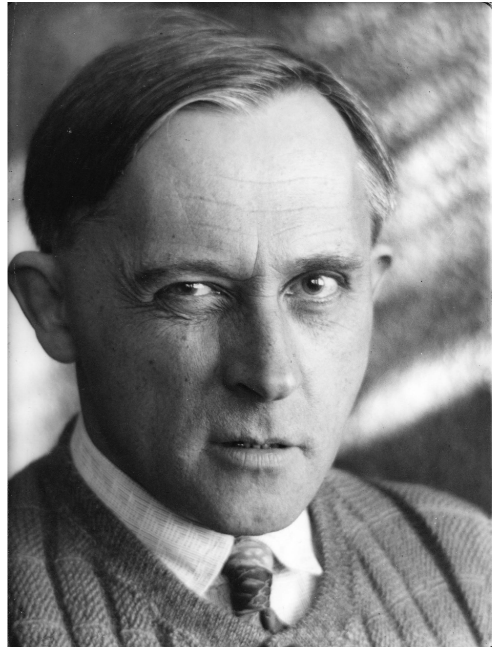
Stanisław Ignacy Witkiewicz