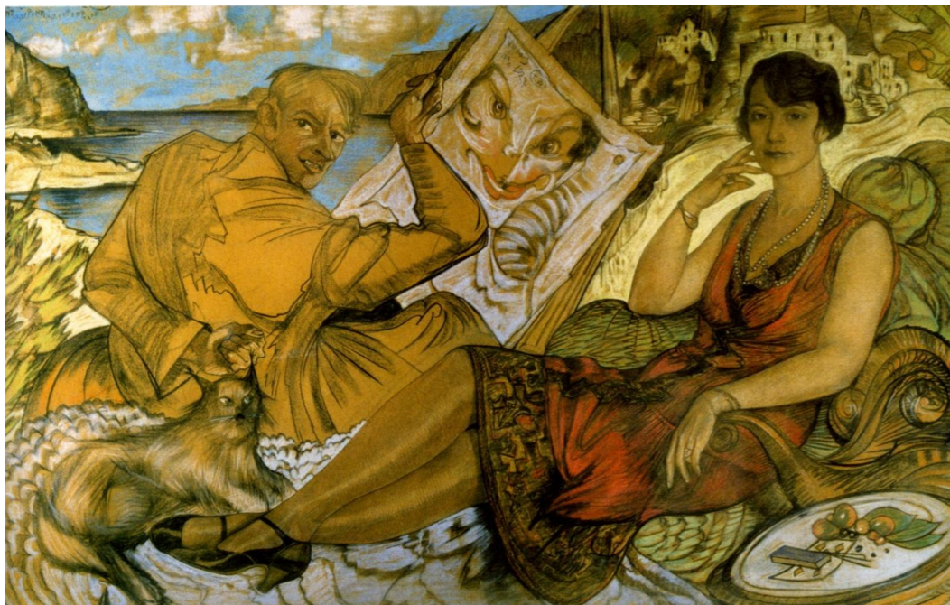
Stanisław Ignacy Witkiewicz Fałsz kobiety , 1927