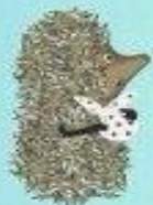
ЕЖИК В ТУМАНЕ