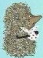
ЕЖИК В ТУМАНЕ