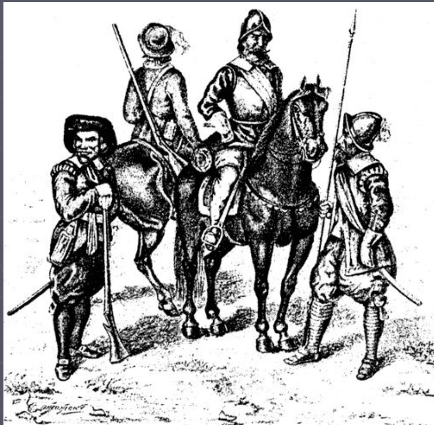
Шведские воины эпохи Густава-Адольфа (слева направо): мушкетер, драгун, кирасир, пикинер