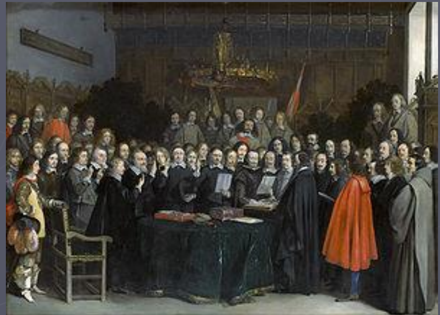
Подписание мира в Мюнстере