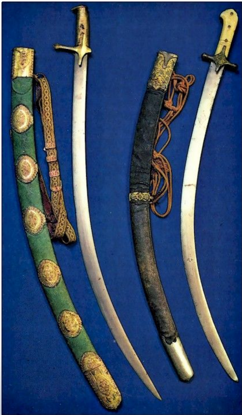
Сабли князя Пожарского и старосты Минина