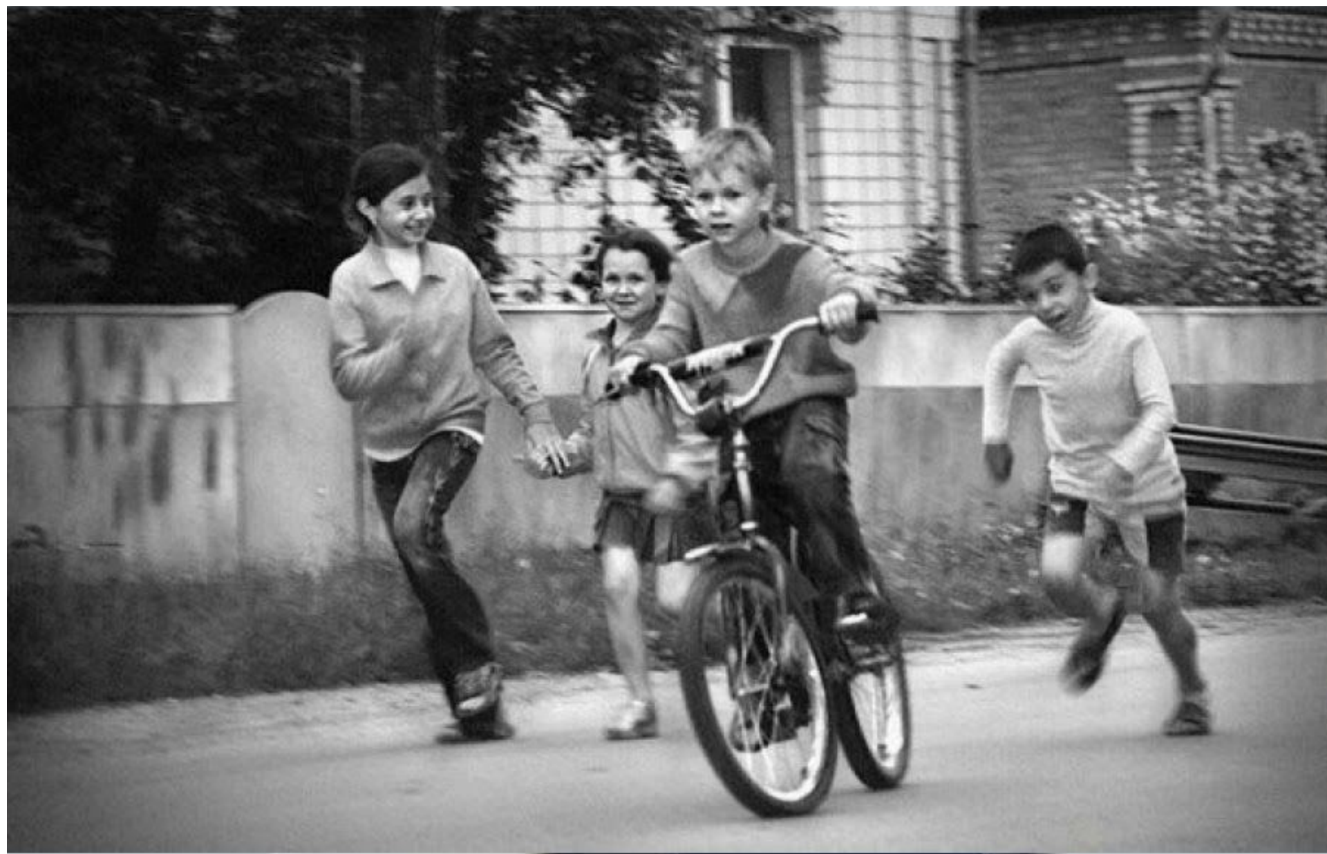
Гонять на велосипедах