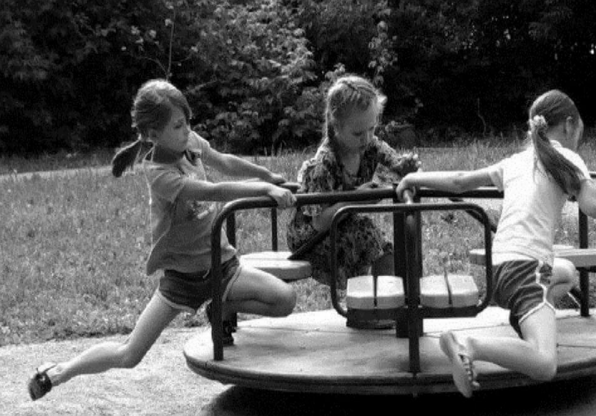
Крутиться на каруселях...