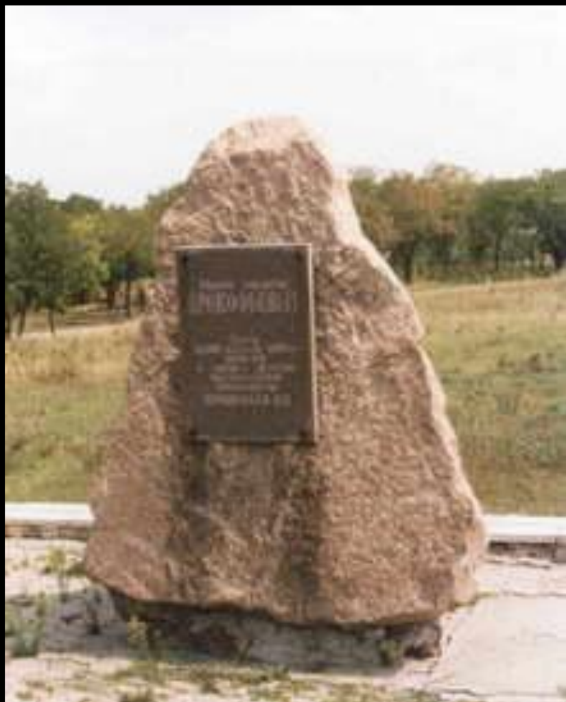
Мемориал на месте усадьбы, в которой родился Сергей Прокофьев