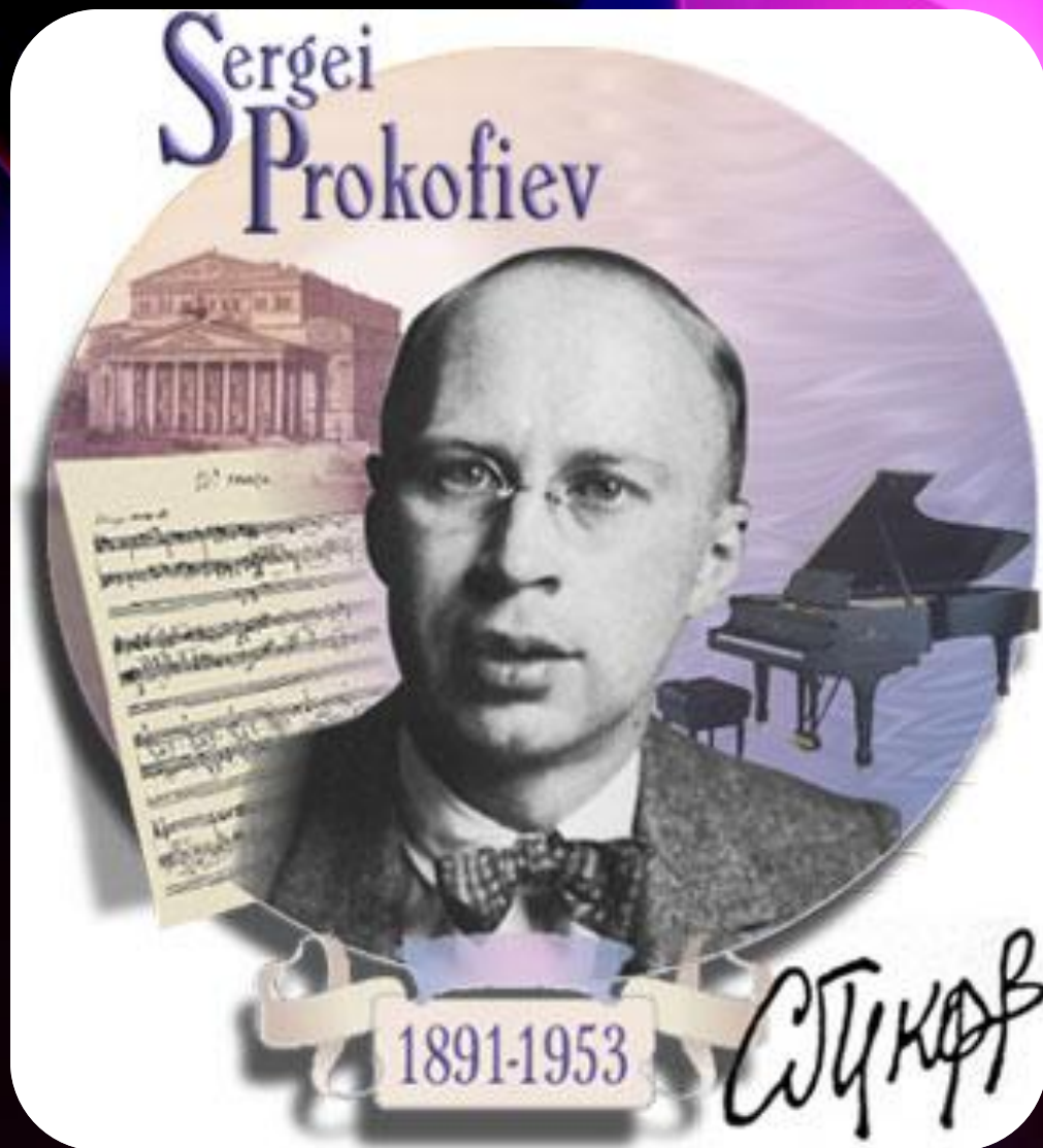
Прокофьев Сергей Сергеевич