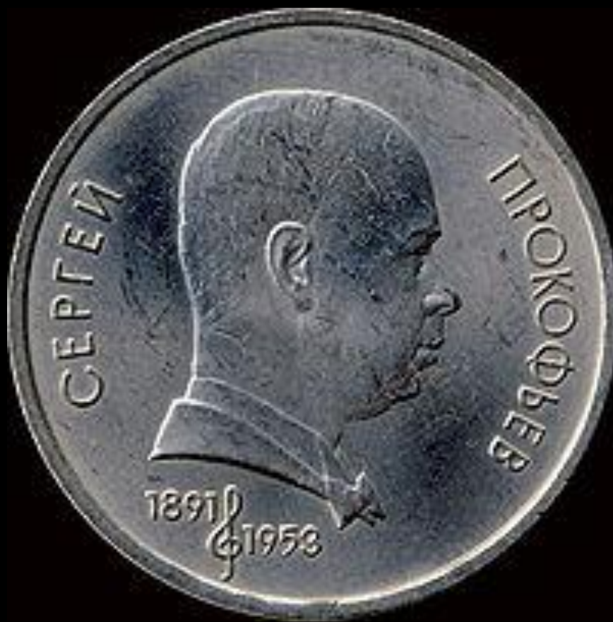
Юбилейная монета СССР, посвящённая С. С. Прокофьеву, 1991, 1 рубль