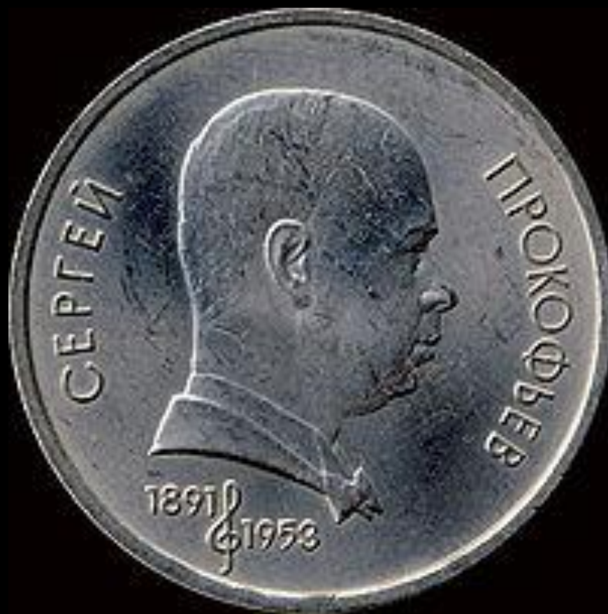
Юбилейная монета СССР, посвящённая С. С. Прокофьеву, 1991, 1 рубль