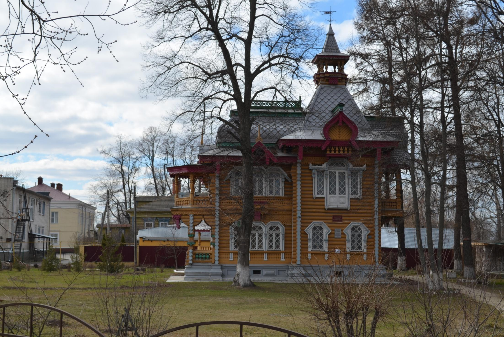
Летняя дача Бугрова объект культурного наследия регионального значения