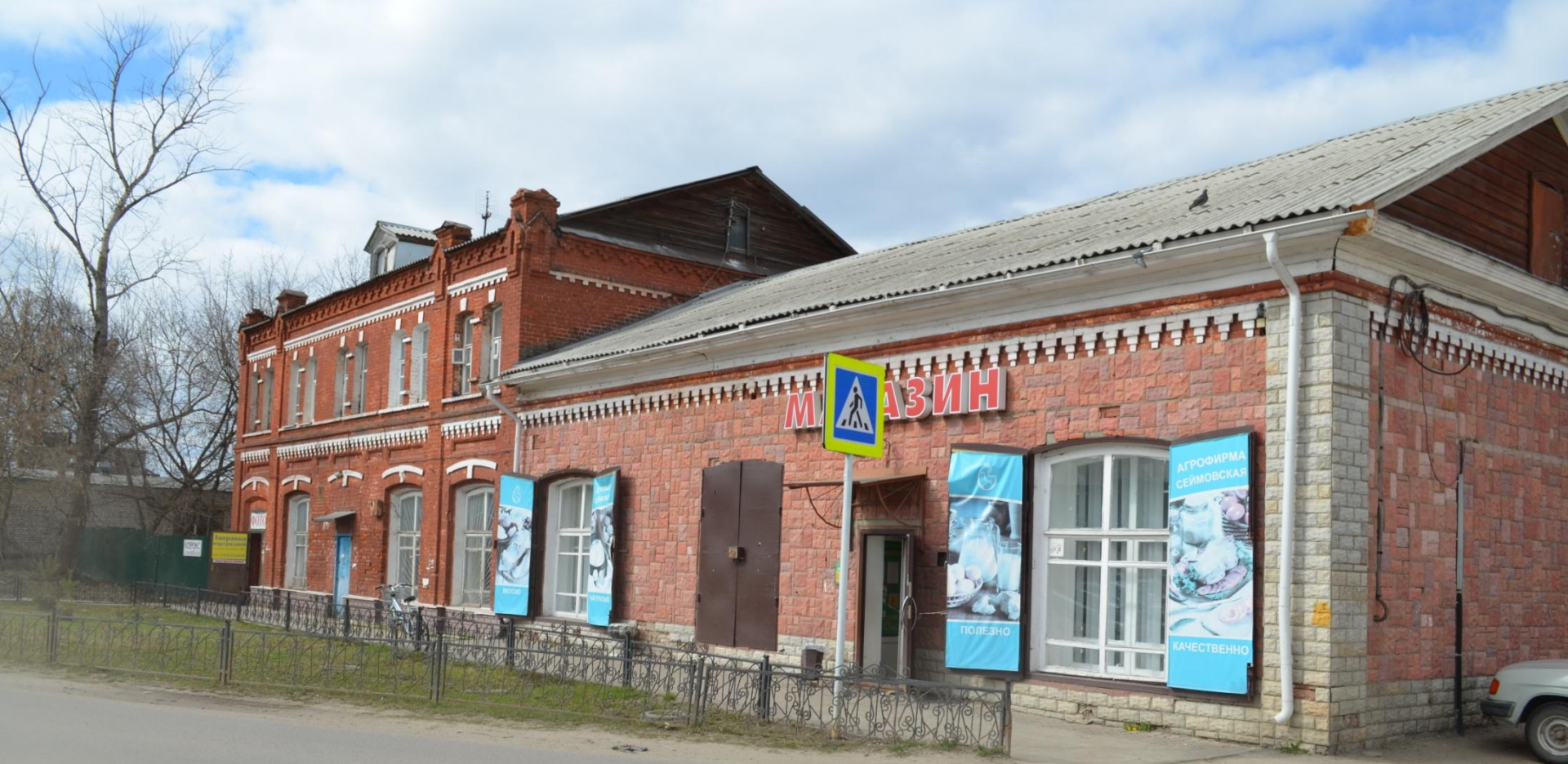
Торговый корпус объекта культурного наследия регионального значения Комплекс крупчаточного механического завода товарищества Н.А. Бугрова (Передельновская мельница)