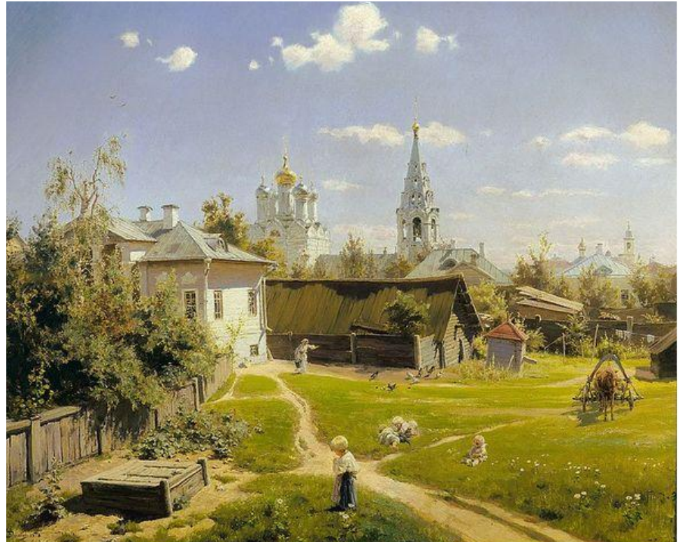
Василий Поленов «Московский дворик»