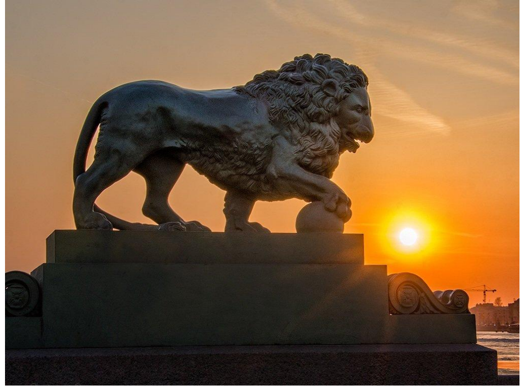
Иван Прокофьев Статуя льва в Санкт- Петербурге