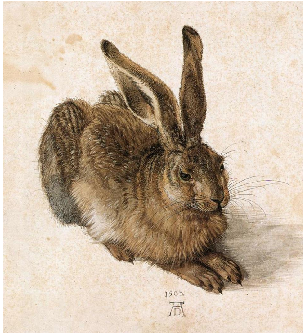
Альбрехт Дюрер «Заяц»