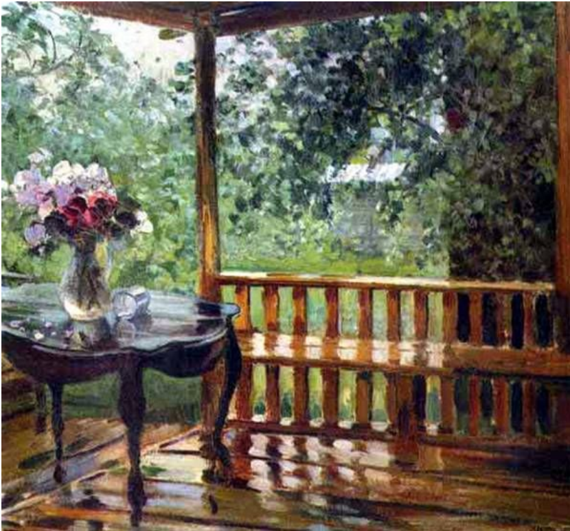
Александр Герасимов «После дождя»