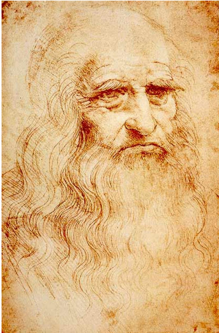
Леонардо да Винчи Алгебра