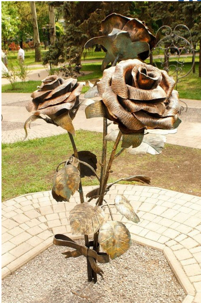
Кованные розы Донецка