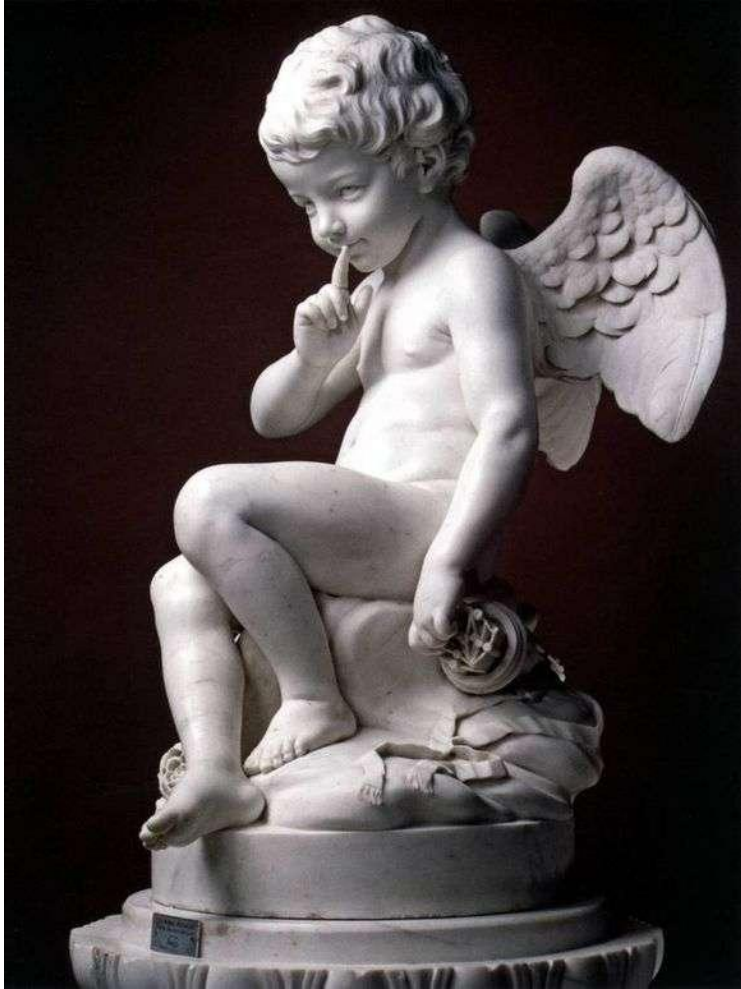
Этьен Морис Фальконе «Амур»