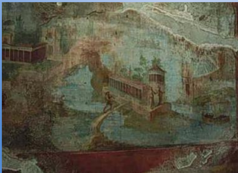
Древняя фреска Геркуланума (Италия)

Фрески – это разноцветная роспись стен по мокрой штукатурке.