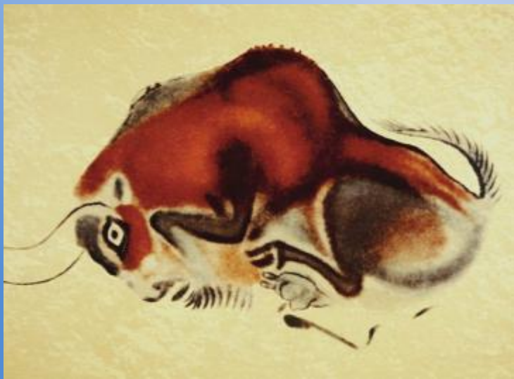
Наскальная живопись пещеры Альтамира (Испания)