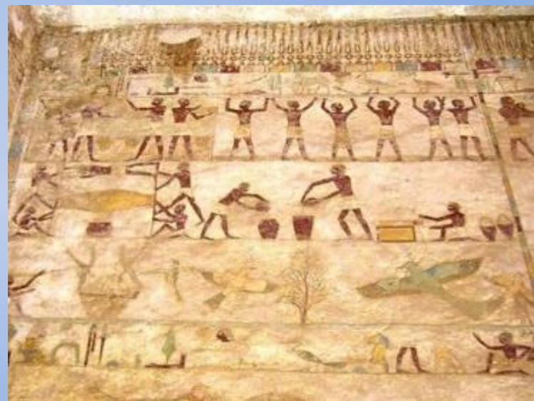
Роспись гробницы Хнумхотепа (Египет)