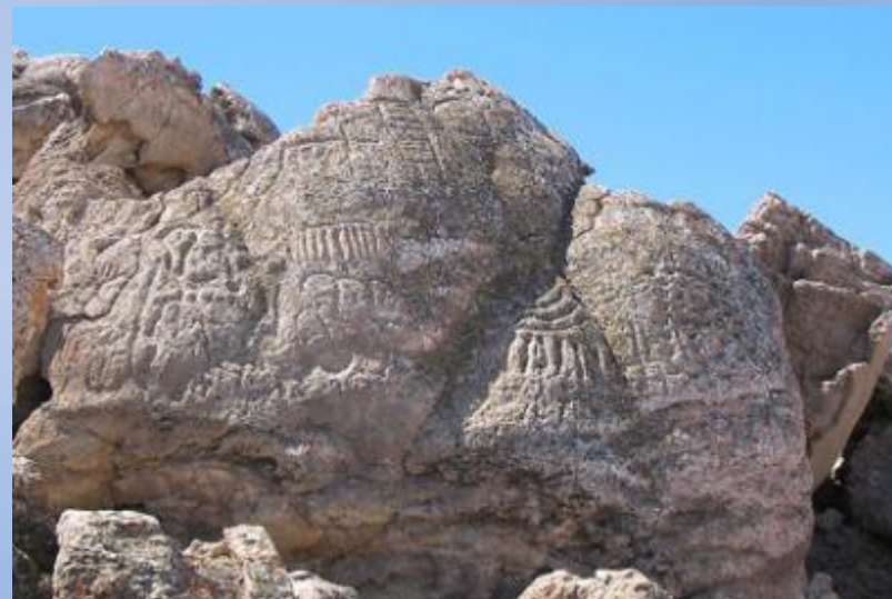
Петроглифы в штате Невада (США)