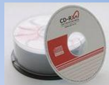
Флеш-карта, лазерные диски