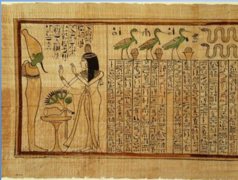
Папирус Древнего Египта