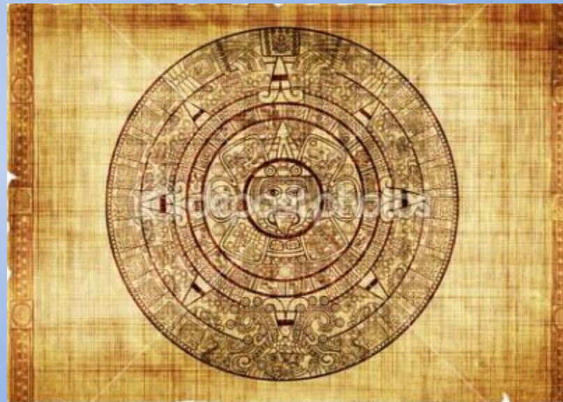
Календарь Майя на древнем Пергаменте (Южная Америка).