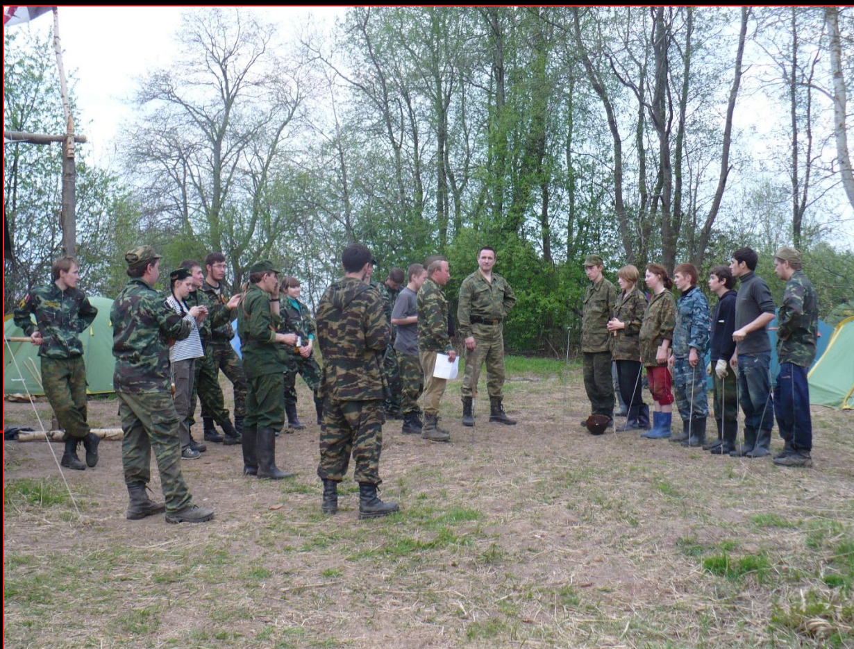
Поисковый отряд «Новый Феникс» (г. Глазов, УР) на местах боев 357 СД. В лесах недалеко от Ржева. Весна, 2010 год.