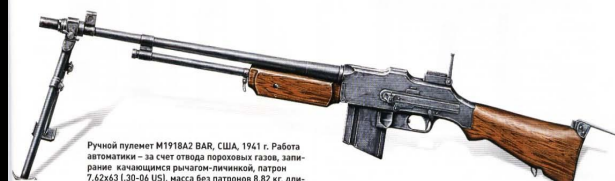
Ручной пулемет M1918A2 BAR, США, 1941 г. Работа автоматики – за счет отвода пороховых газов, запирание – качающимся рычагом-личинкой, патрон 7,62x51 (.30-06 US), масса без патронов 9,82 кг, длина – 1 219 мм, огонь – непрерывный, темп стрельбы – 500 выстр./мин, емкость магазина – 20 патронов