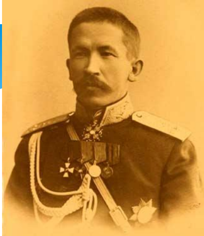
Лавр Георгиевич Корнилов