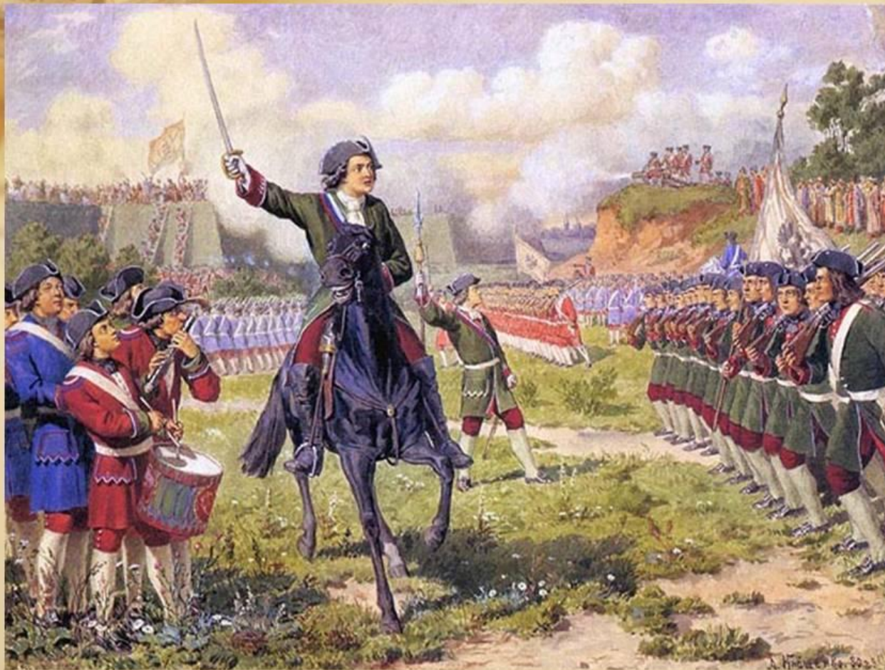
Игры потешных войск Петра I возле села Преображенское