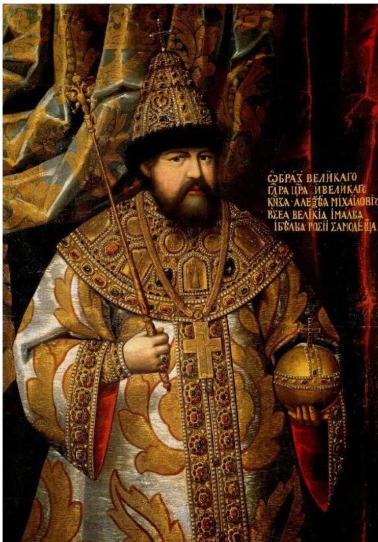
Отец – царь Алексей Михайлович