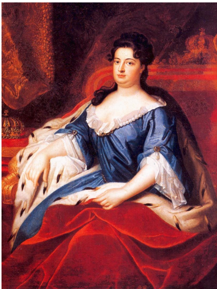
Мать- Наталья Нарышкина, вторая жена Алексея Михайловича