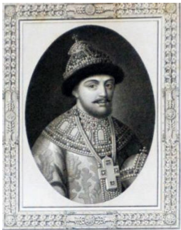
ЦАРЬ ФЕОДОРЪ III АЛЕКСѢЕВИЧЪ.