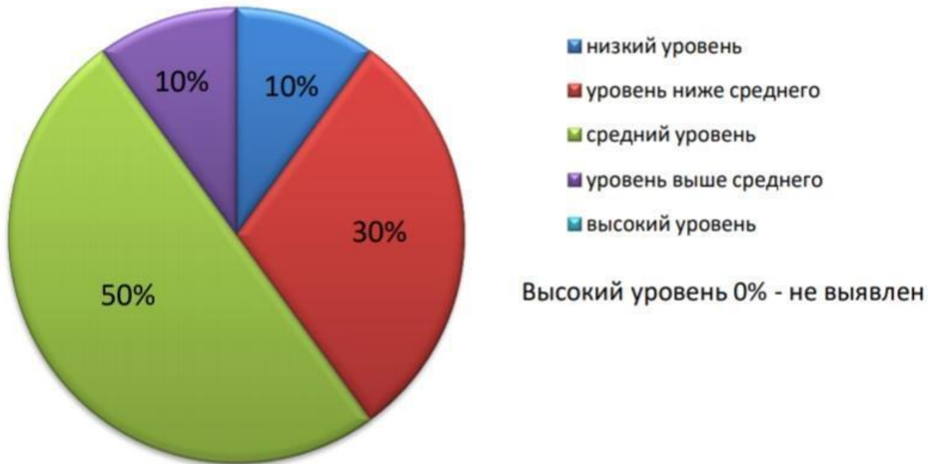
Рисунок 2. Результаты обследования активного глагольного словаря по уровням (в%)