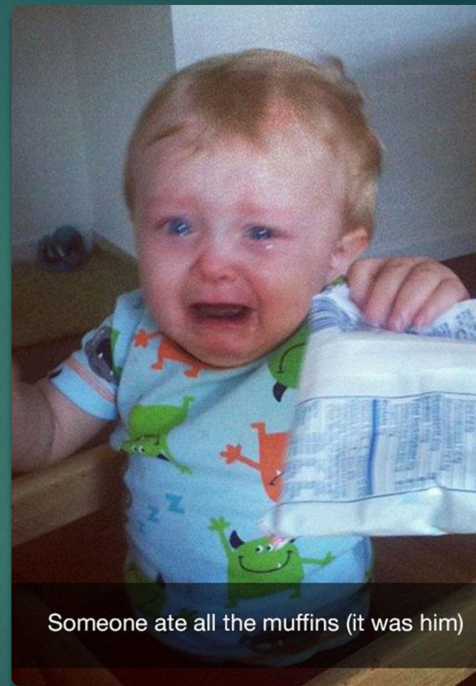
Someone ate all the muffins (it was him)

Ну как же рука только поднимается На ужас в глазах и поток слёз?!