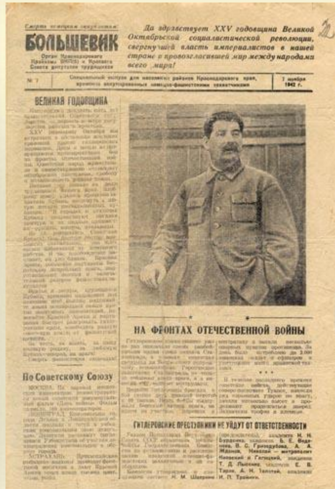
Газета "Большевик". № 7. 7 ноября 1942 г.

Кустов было первоначально семь: Анапский, Новороссийский, Краснодарский, Нефтегорский, Майкопский, Мостовской и Сочинский (резервный), за каждым закреплялась определенная группа отрядов общей численностью 5500 человек. Эти отряды дислоцировались в северных предгорьях Главного Кавказского хребта на фронте от верховьев рек Уруп, Большая и Малая Лаба до Новороссийска, на Таманском полуострове и в низовьях рек Кубани и Протоки.