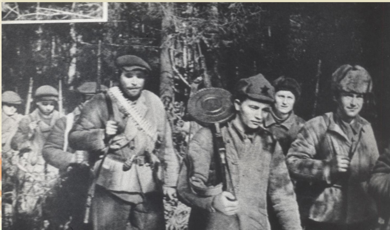
Партизаны в походе

Объединенный партизанский отряд "Горный" был сформирован 8 августа 1942 г. на базе Горячеключевского, Кореновского и Староминского партизанских отрядов, входил в состав Краснодарского куста партизанских отрядов.