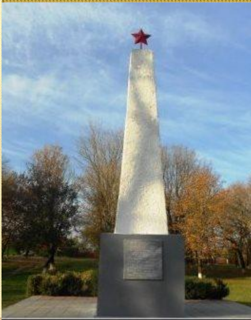
Братская могила в станице Кисляковской

По заданию командования партизанского отряда Коля перерезал главный телефонный кабель, связывающий гитлеровские воинские части со штабом. Связь прервалась. Этим воспользовались партизаны, совершив нападение на фашистское воинское подразделение. И снова — массовые аресты, допросы. На одном из них кто-то из жителей станицы указал на Колю.