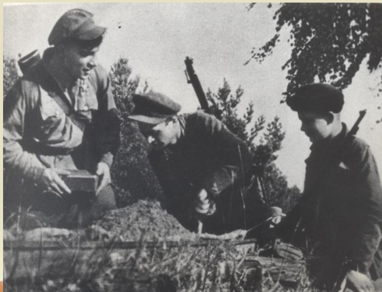
Закладка взрывчатки на дороге

Партизаны Кубани провели немало диверсионных действий на дорогах, в частности, на шоссейной и железнодорожной дорогах Краснодар — Новороссийск