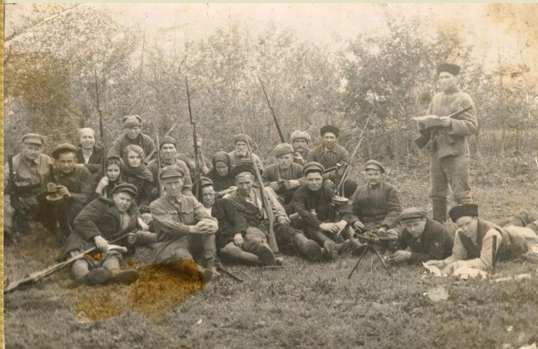
Партизаны Марьянского отряда Кубанец 1942 г.

В сентябре 1942 года партизаны все активнее начали осуществлять диверсии на коммуникациях в тылу врага, вырезая телефонные провода, минирруя дороги, взрывая мосты. Уже 11 сентября в районе станиц Ильской и Холмской полетел под откос вражеский эшелон с боеприпасами, подорванный Черноерковским партизанским отрядом. В отчетах также упоминается воинский эшелон, уничтоженный в сентябре партизанами отрядов "Шторм", "Бойкий" и "Решительный" между Абинской и Линеиной. В результате этой диверсии ликвидировано до 200 солдат и офицеров противника.