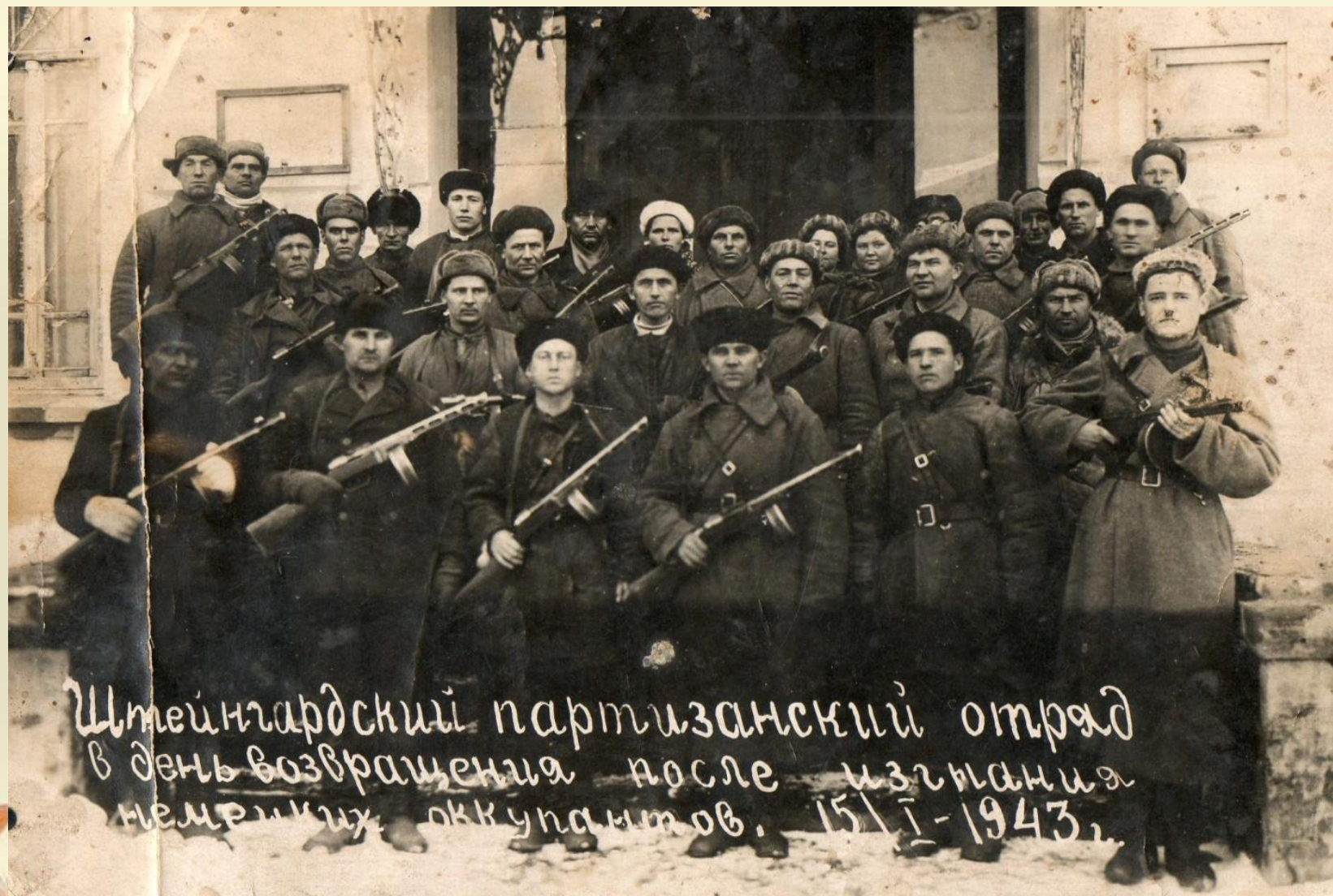
Штейнгардский партизанский отряд в день возвращения после изгнания немецких оккупантов. 15/1-1943.