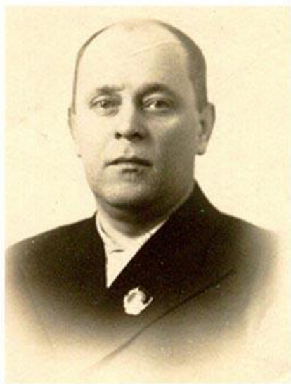
Селезнев Петр Ианнуарьевич, первый секретарь Краснодарского крайкома ВКП(б) (февраль 1939 г. - март 1949 г.)

3 сентября 1942г. В Краснодарском крае постановлением крайкома ВКП (б) для руководства партизанским движением в крае создан краевой штаб партизанского движения в составе П.И. Селезнева, П.Ф. Тюляева и К.Г. Тимошенкова и утверждена дислокация партизанских отрядов по кустам.