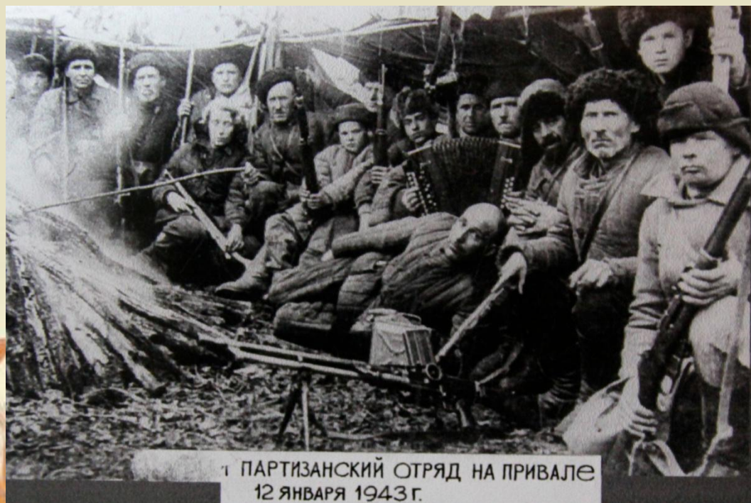
ПАРТИЗАНСКИЙ ОТРЯД НА ПРИВАЛЕ 12 ЯНВАРЯ 1943 Г.

В годы войны была поговорка: «Фашистам много жарких бань дала советская Кубань!»