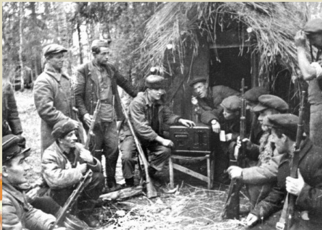
Партизаны слушают сводки из Совинформбюро

Согласно сводкам Южного штаба партизанского движения, за этот месяц зафиксировано более ста случаев боевого соприкосновения партизан с противником. Одновременно партизаны оказывали помощь военным, выступая в качестве проводников. Например, отряды Нефтегорского куста за период с 20 сентября по 7 октября 1942 года провели в тыл врагов восемь армейских разведок и вывели из расположения противника 500 бойцов Красной Армии.