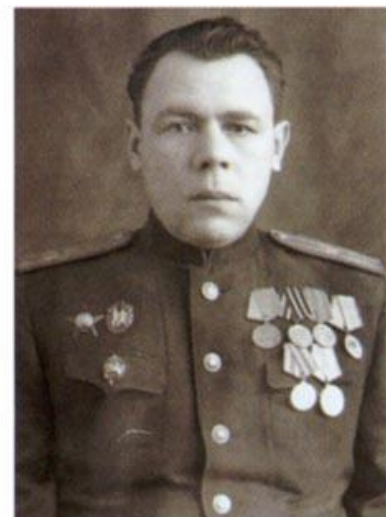
Тимошенков Константин Григорьевич, начальник Управления НКГБ (НКВД) Краснодарского края (апрель 1941 г. - апрель 1943 г.)