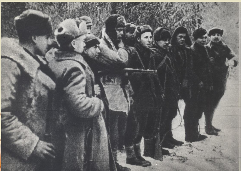
Партизаны в строю

Первый - это организованное подполье из числа работников совпартактива и органов НКВД, специально оставленных в тылу врага. Эта подпольная сеть понесла большие потери в первые же недели оккупации.