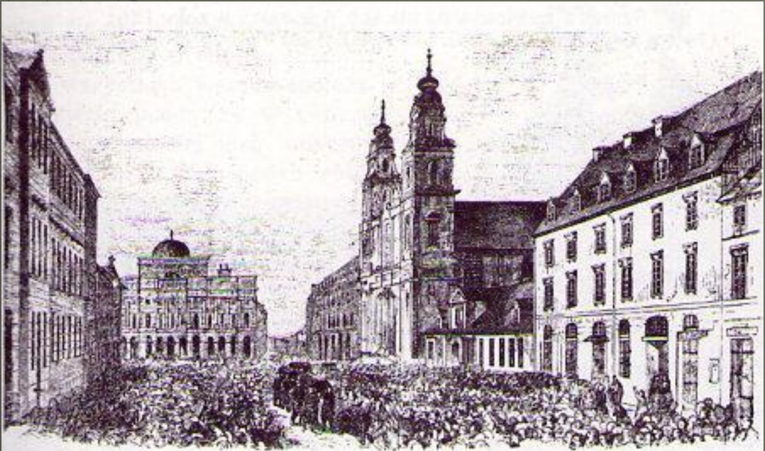
Pogrzeb pięciu poległych; 2 marca 1861 r. w Warszawie