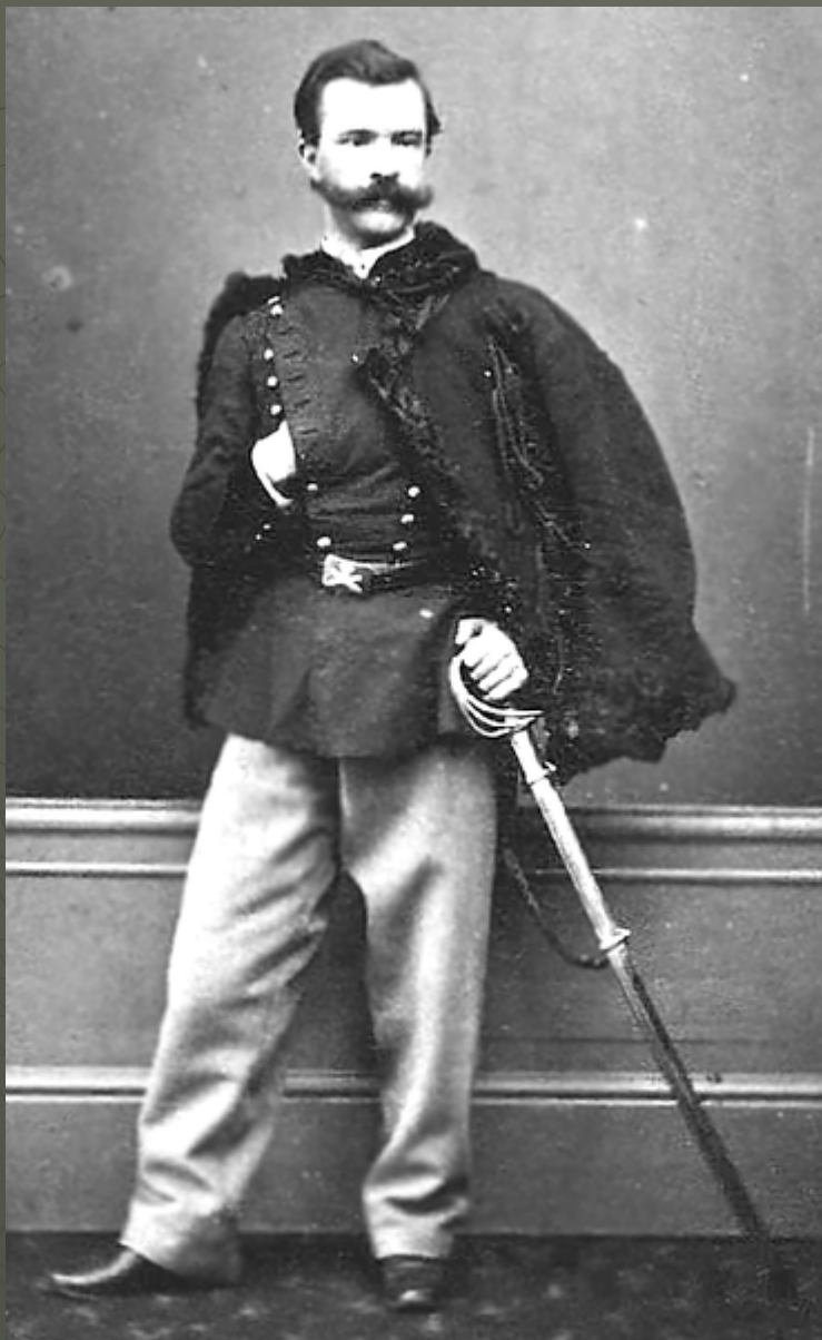
gen. Marian Langiewicz