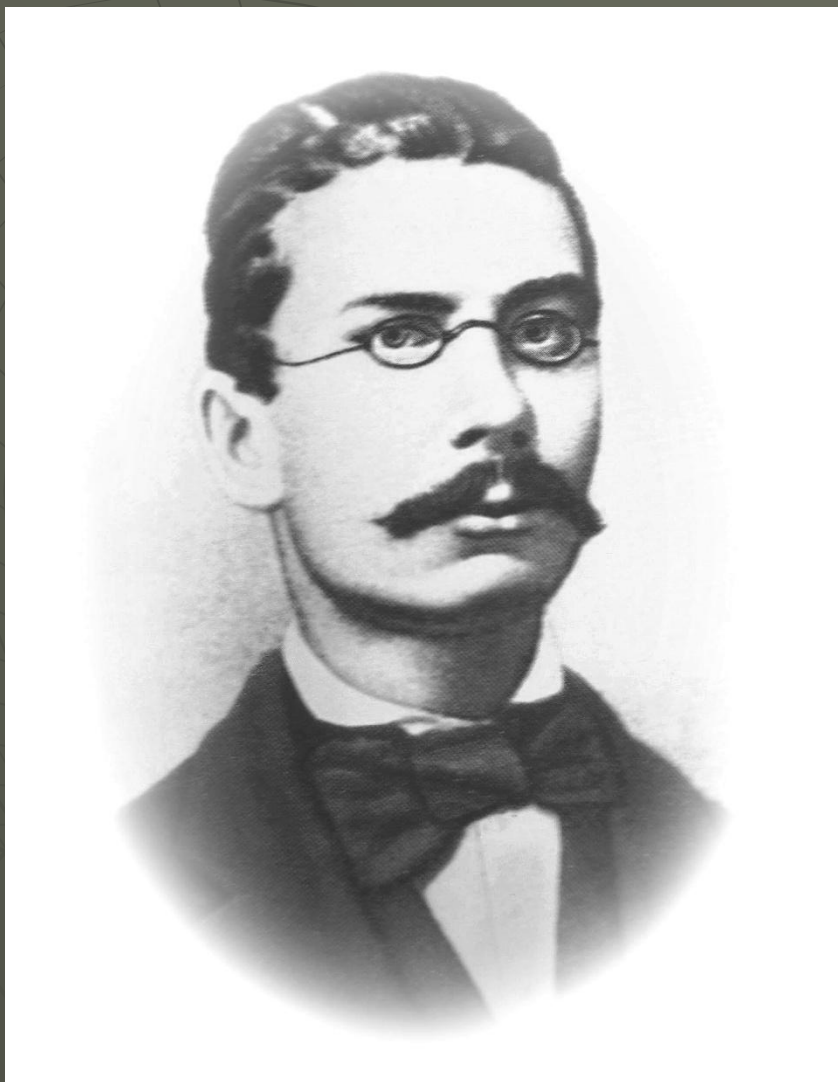
gen. Romuald Traugutt