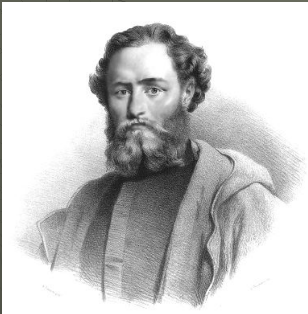
gen. Ludwik Mierosławski