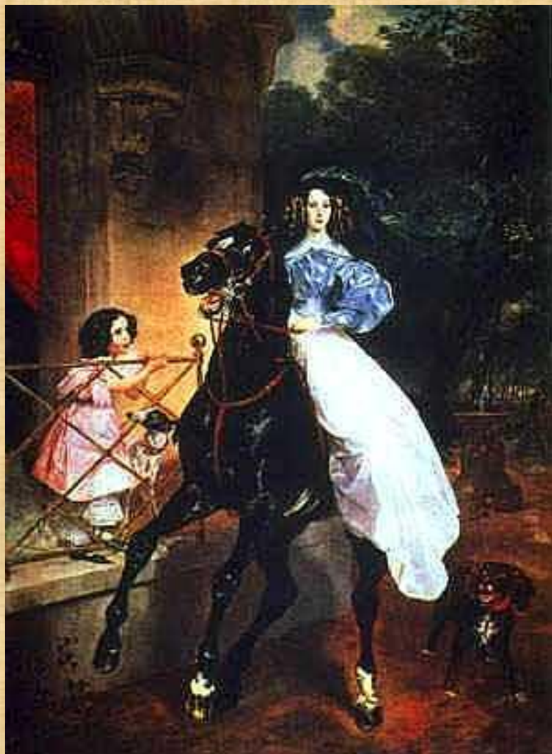
К. Брюллов «Всадница».