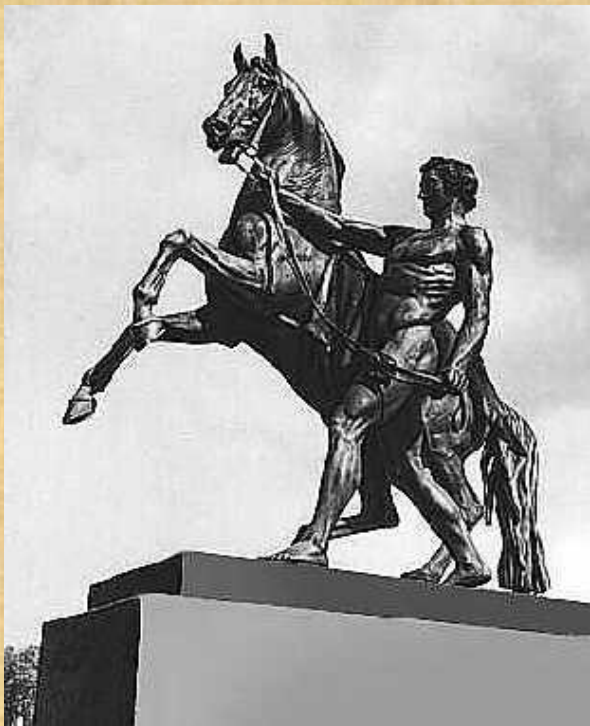
П. К. Клодт

- отмечено сочетанием познавательного восприятия животного мира с острой характеристикой декоративной выразительности образов.