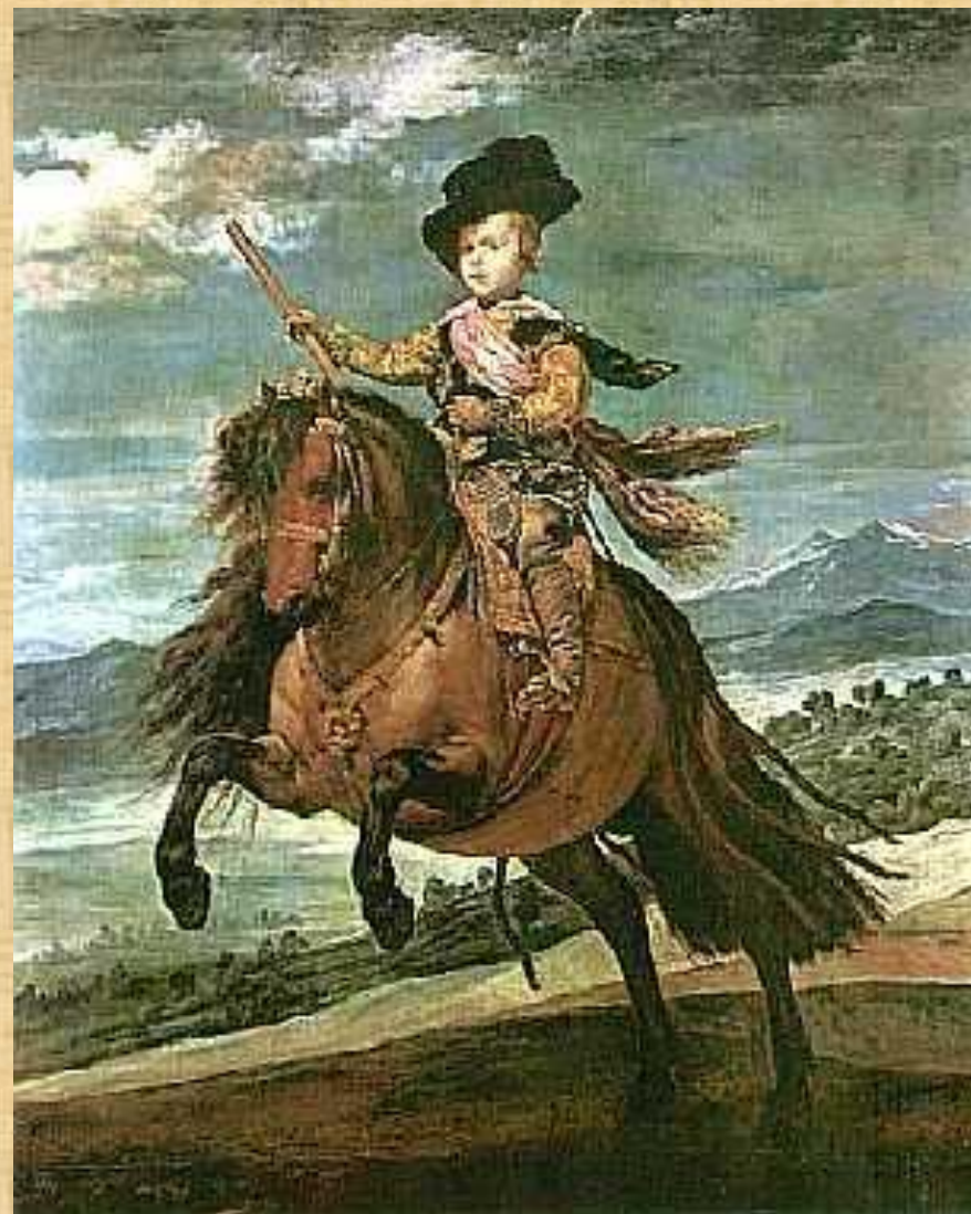
Диего Веласкес «Портрет принца Балтазара Карлоса».