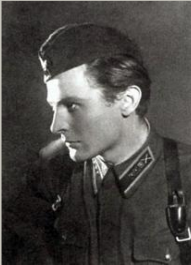
А. Фатьянов в форме старшего лейтенанта артиллерии 1941-1945 г.г.