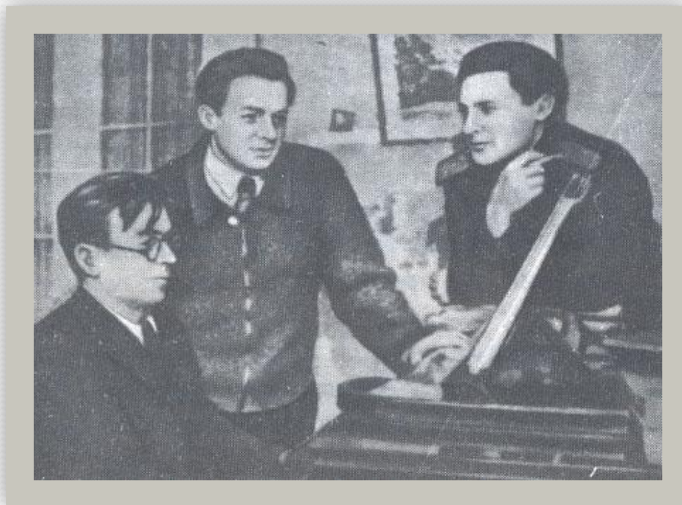
Композитор В. Соловьёв-Седой и поэт А.Фатьянов