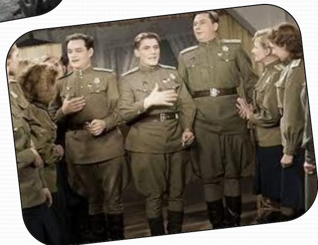
Кадры из кинофильма «Небесный тихоход»