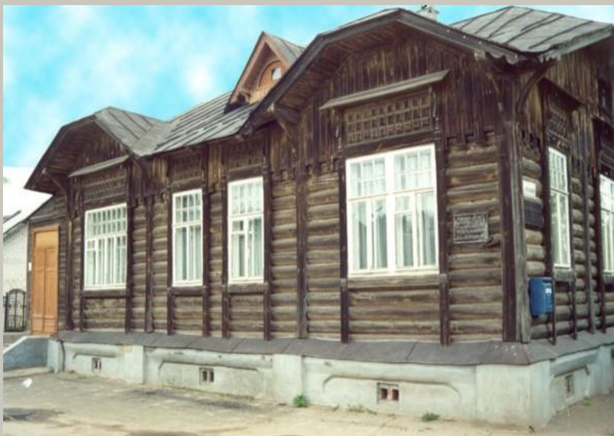
Дом А. И. Фатъянова в Малом Петрино