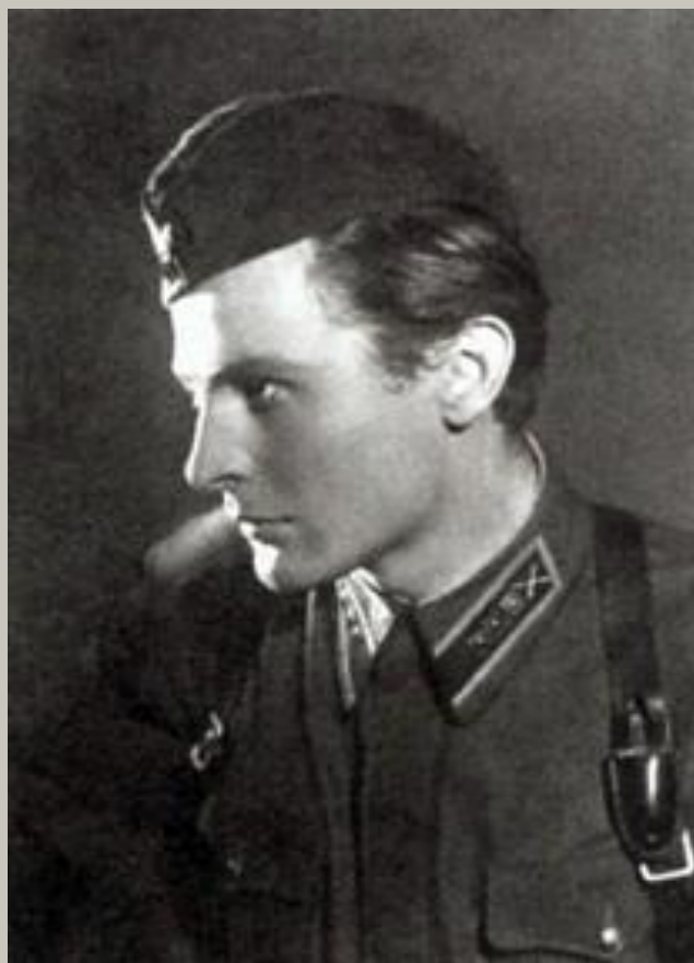
А. Фатьянов в форме старшего лейтенанта артиллерии 1941-1945 г.г.