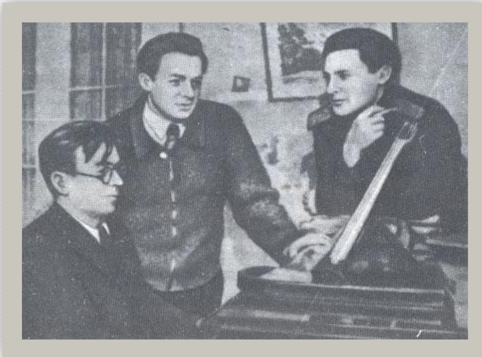
Композитор В. Соловьёв-Седой и поэт А. Фатьянов