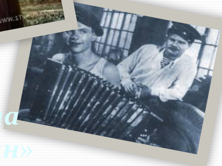
Кадры из кинофильма «Солдат Иван Бровкин»