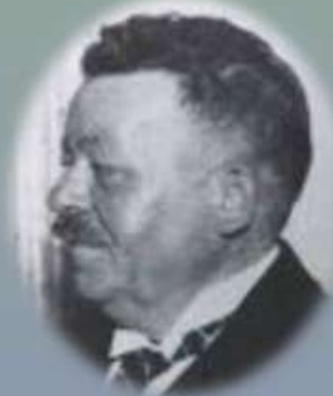
Ф. Еберт – I президент

31 липня 1919р. - Веймарська Конституція