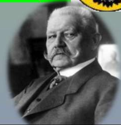
Гінденбург- останній президент