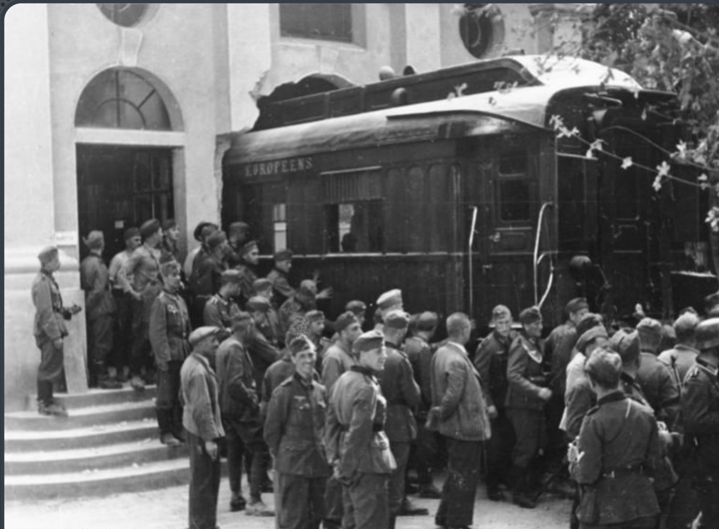
21. Juni 1940