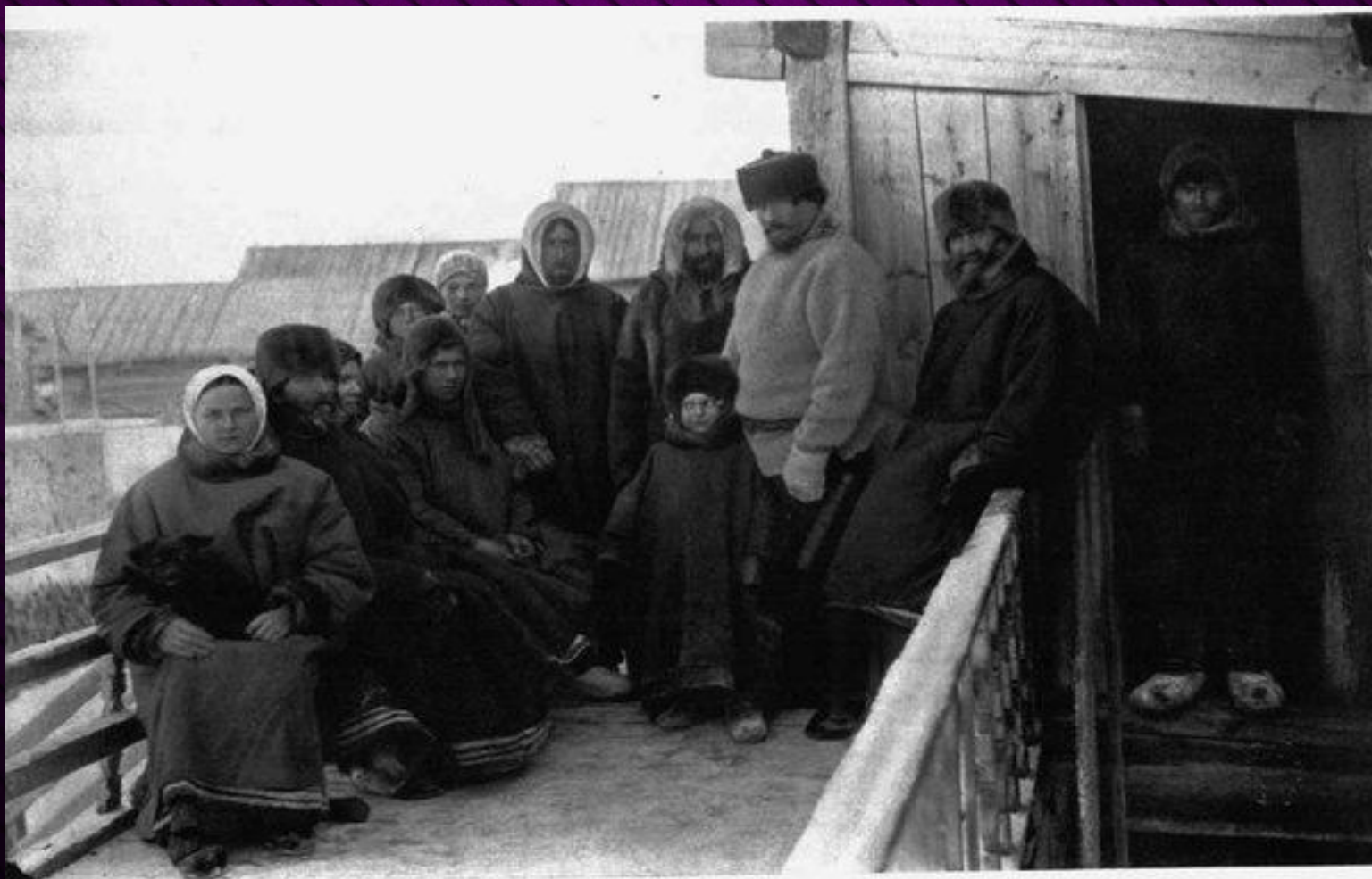
Типы поморовъ (въ зимней одеждѣ).

итие Русского Севера – это модель жизни свободного , даже в эпоху крепостничества независимого, экономически обеспеченного, верующего русского крестьянина , «государственника» по своему мышлению