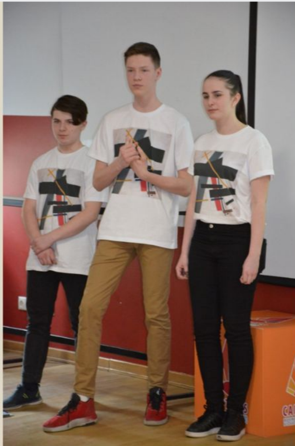
Фото нашей команды