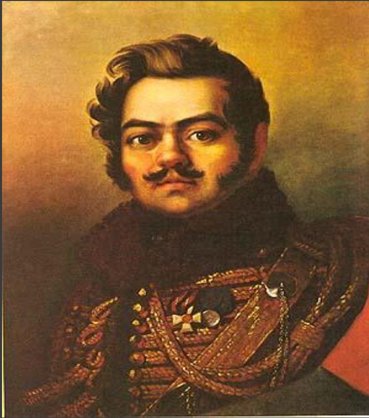
Денис Васильевич Давыдов.