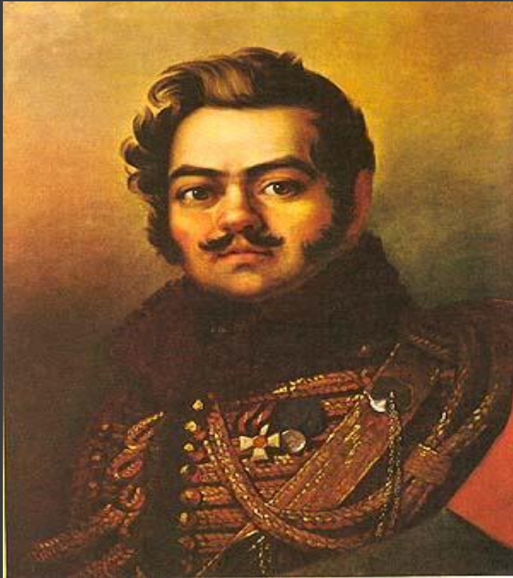
Денис Васильевич Давыдов.