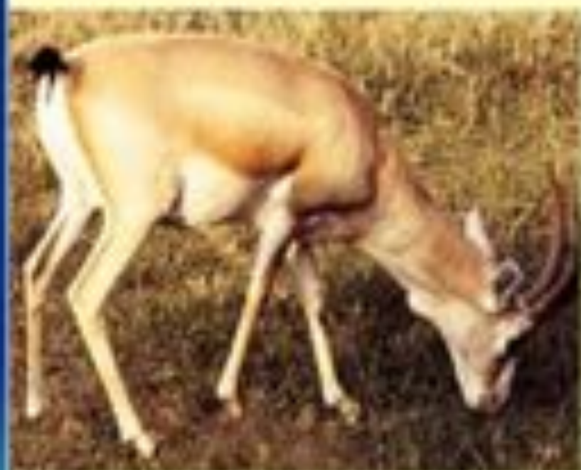
Джейран ( Gazella subditylosa ).