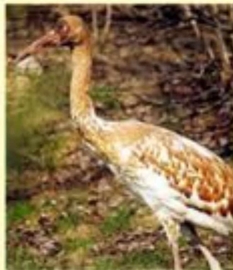
Молодые стерхи (Grus)