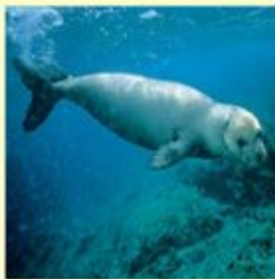
Тюлень-монах. Средиземное море.

В большинстве своём это крупные или средние звери. Длина их тела от 1 до 6 метров, масса от 20 кг до 5 тонн. Тюлени проживают в приполярных широтах. В России обитают 9 видов настоящих тюлений.