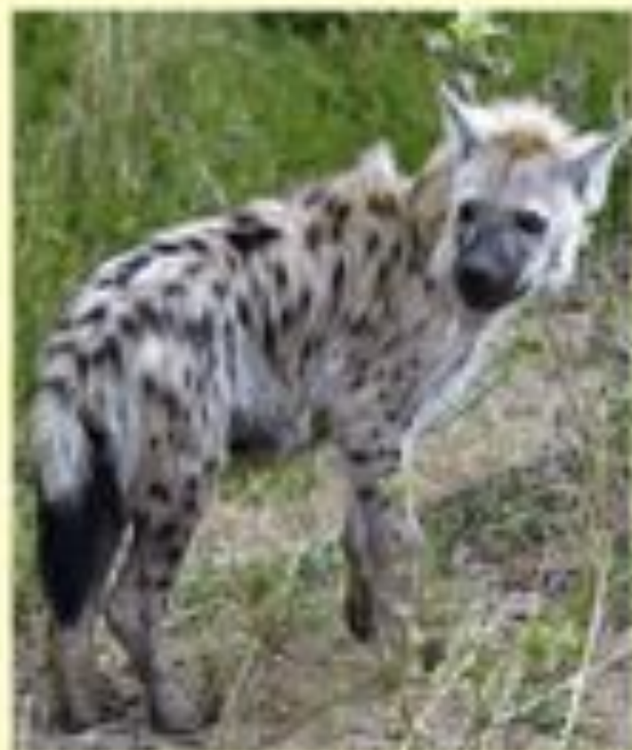
Пятнистая гиена ( Crocuta crocuta ).