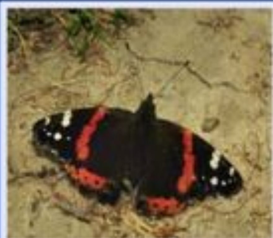
Адмирал ( Vanessa atalanta ).

Окраска пестрая. Обитает на лесных опушках, в садах, в парках. Гусеницы живут на листьях крапивы, чертополоха, культурным растениям не вредят. Численность бабочек сокращается.