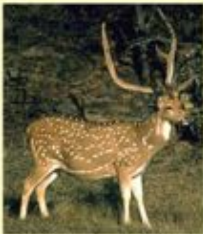
Пятнистый олень.