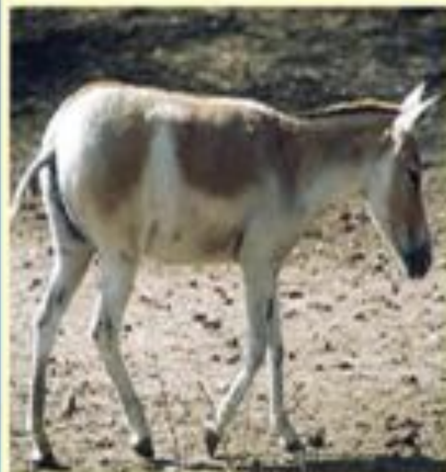
Кулан ( Equus hemionus ).

Куланы — вид непарнокопытных млекопитающих рода лошадей. У кулана хорошо развиты зрение, слух, обоняние. Щелчок фотоаппарата они слышат на расстоянии 60 метров. Куланы молчаливы и редко кричат. Стада куланов пахутся сейчас только в заповедниках Туркменинии. Сейчас кулана расселяют в новые места.