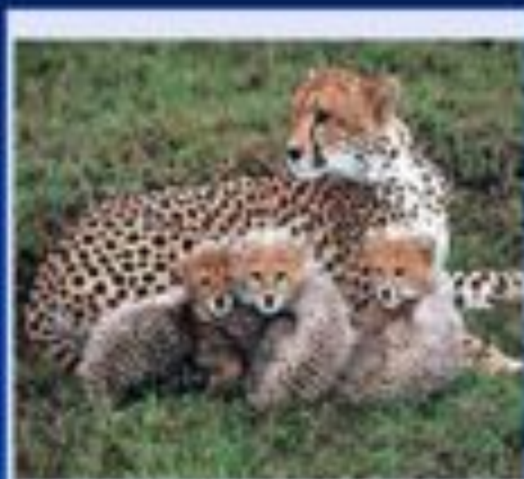
Гепард ( Acinonyx jubatus ) — охраняемый вид, занесенный в Международную Красную книгу.