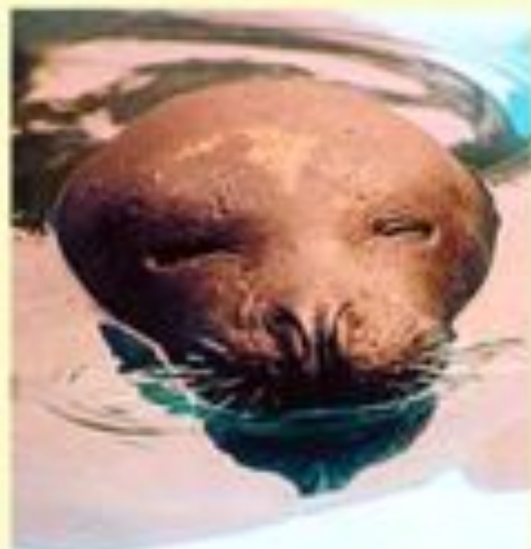
Тюлень в воде.

Тюлени питаются рыбой, моллюсками, ракообразными. Численность тюлений сокращается и некоторые виды находятся под охраной.