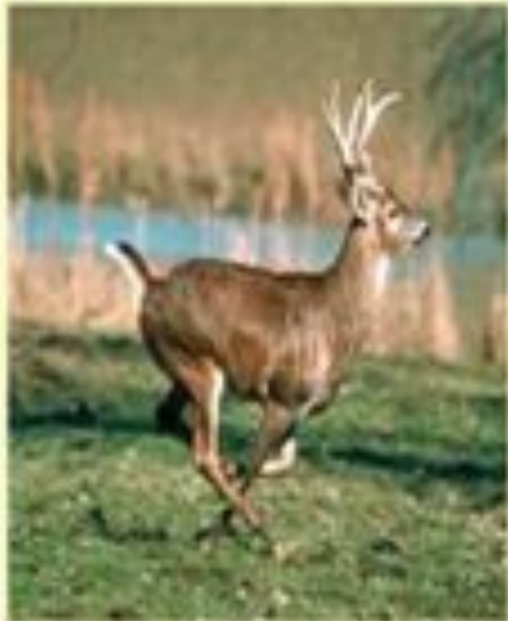
Американский белохвостый олень очень похож на европейскую косулю.