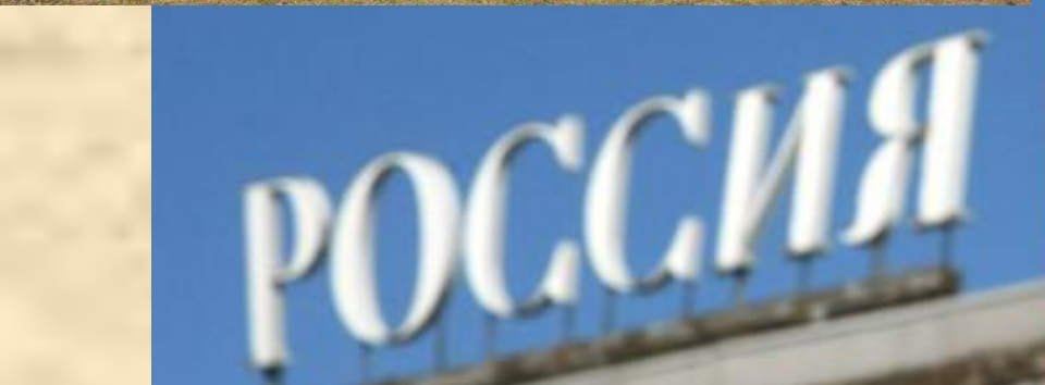
Российско- Финская граница