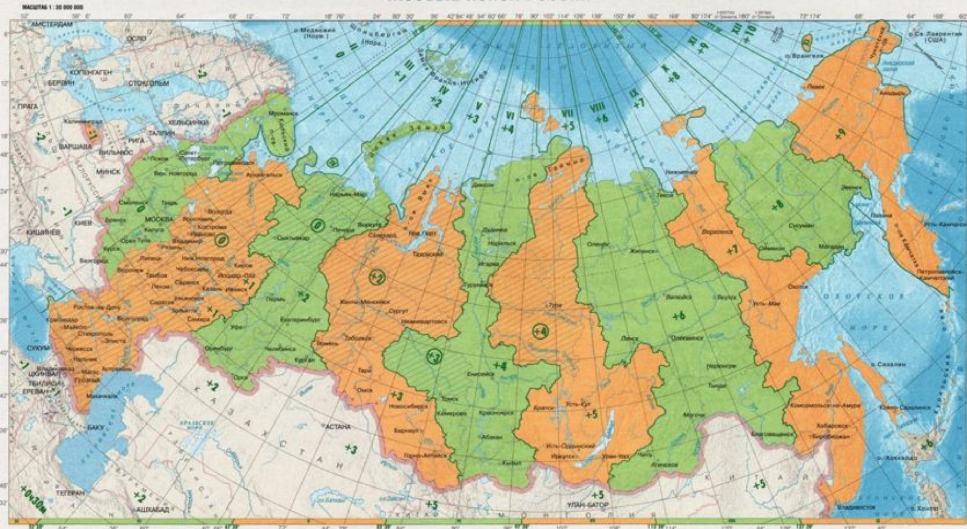
ЧАСОВЫЕ ПОЯСА РОССИИ