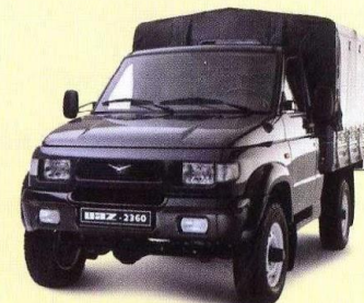
УАЗ-2360 Cargo 2004