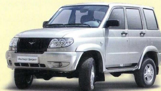
UAZ Patriot Sport