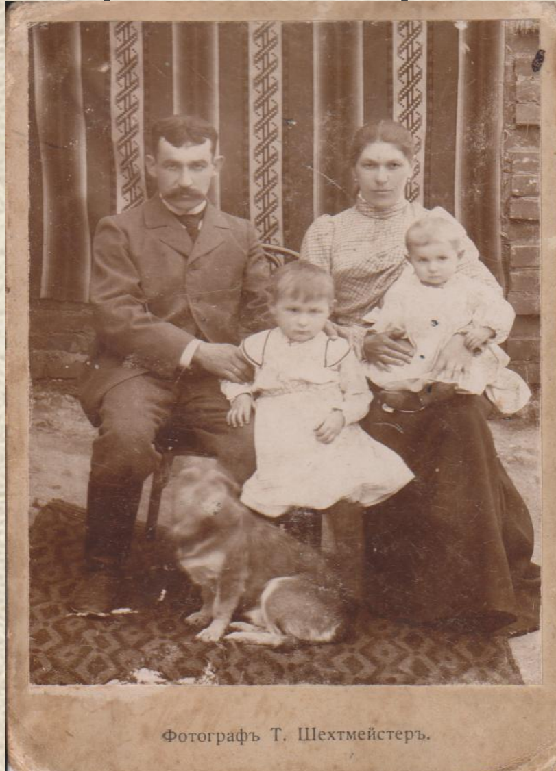
Фотографъ Т. Шехтмейстеръ.