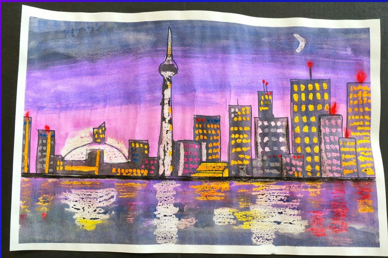
Рисуем ночной город