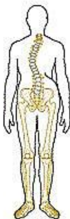
Сколиоз (боковое искривление грудного отдела позвоночника)