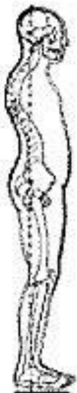
вогнуто-круглая спина (искривление грудного отдела)