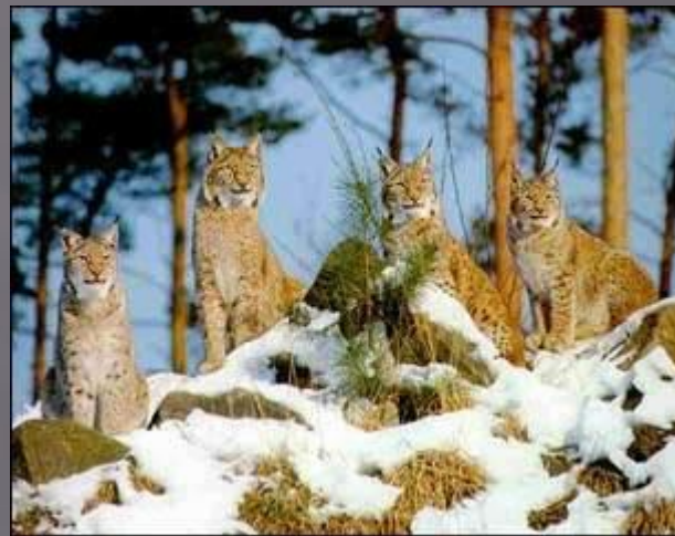
Рысь - типичная кошка, хотя величиной с крупную собаку, которую отчасти и напоминает своим заметно укороченным телом и длинноногостью.