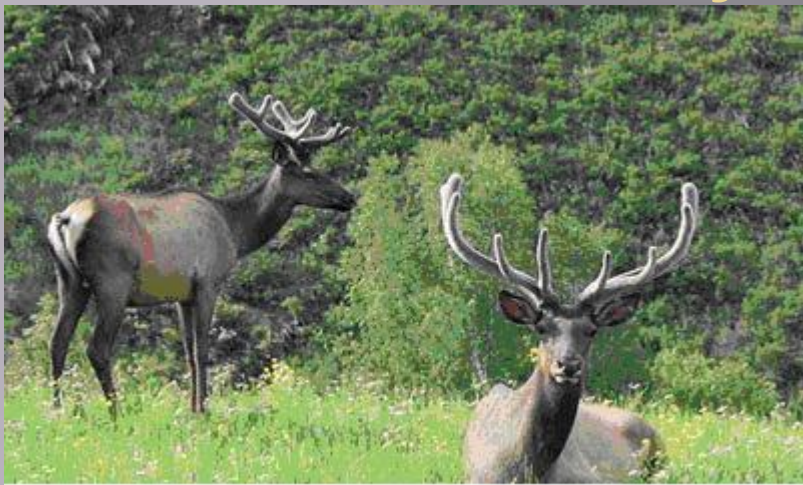
Марал - это наиболее крупный подвид благородного оленя