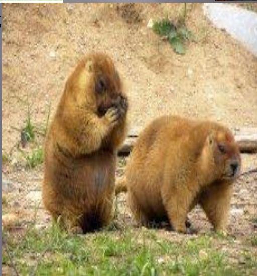
Сурки, в том числе и байбак, относятся к числу самых крупных представителей семейства беличьих.