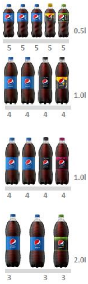
Стойка 400x400 мм