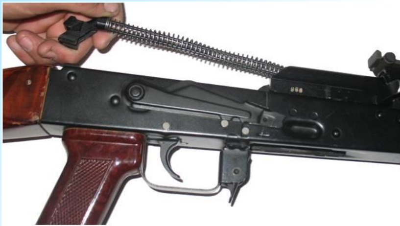
Отделить возвратный механизм