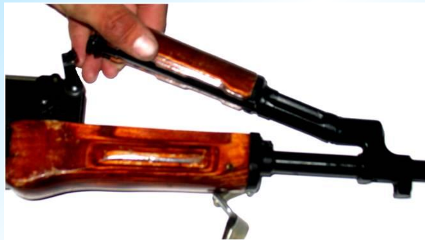
Отделить газовую трубку со ствольной накладкой