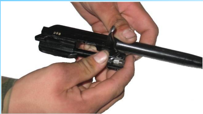
Отделить затвор от затворной рамы