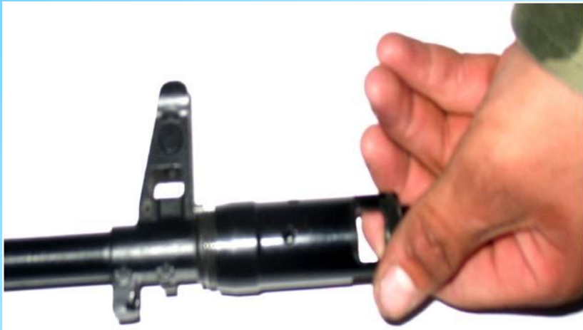
Отделить дульный тормоз - компенсатор