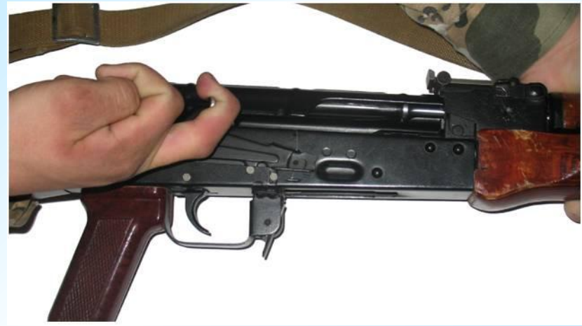
Отвести затворную раму назад и убедиться, что в патроннике нет патрона