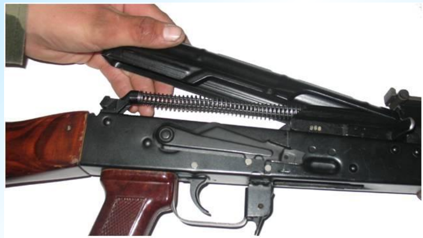
Отделить крышку ствольной коробки