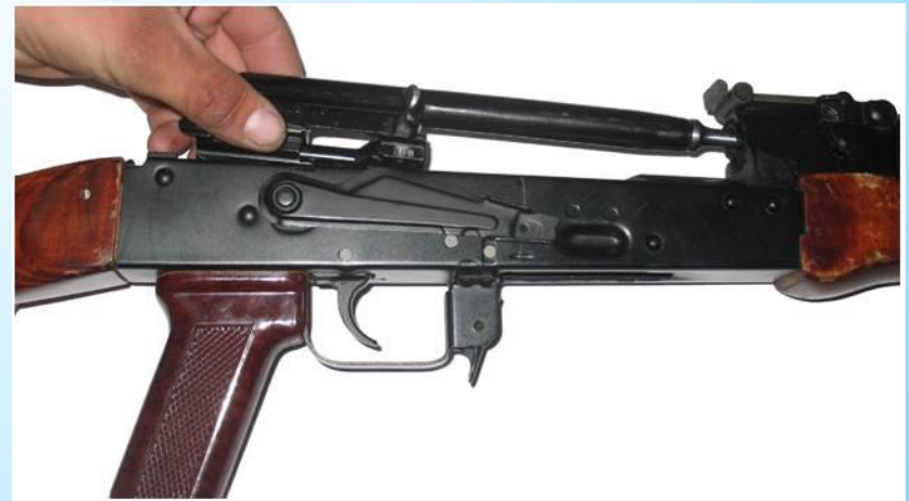
Отделить затворную раму с затвором