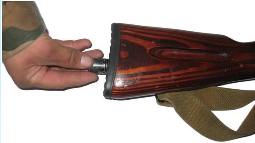
вынуть пенал с принадлежностями