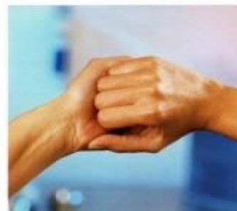
Внешняя сторона пальцев на противоположной ладони с перекрещенными пальцами