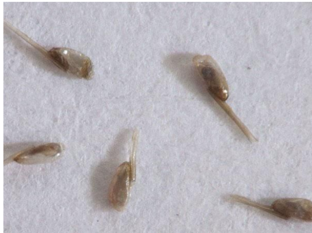
Гниды (при надавливании – щелчок)