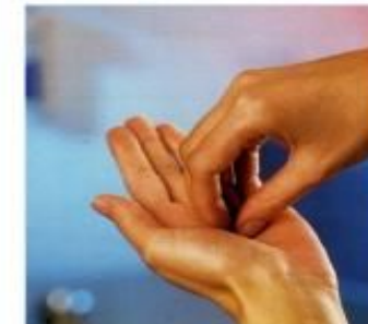
Кругообразное втирание сомкнутых кончиков пальцев правой руки на левой ладони и наоборот