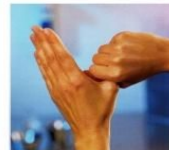
Кругообразное растирание левого большого пальца в закрытой ладони правой руки и наоборот