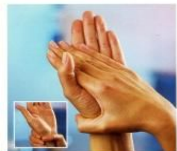
Ладонь к ладони, включая запястья