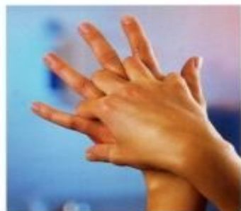
Правая ладонь на левую тыльную сторону кисти и левая ладонь на правую тыльную сторону кисти