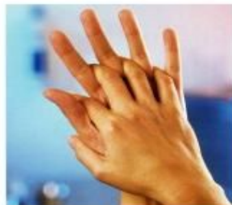
Ладонь к ладони рук с перекрещенными пальцами