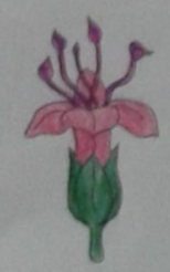
Раскрась цветок подорожника