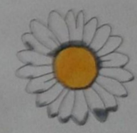
Раскрась цветок ромашки