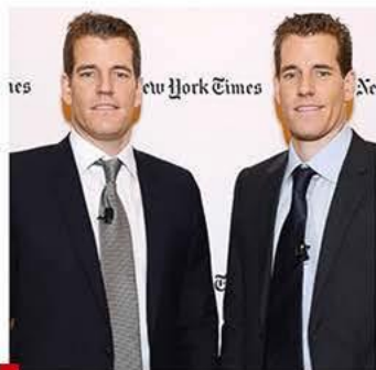
Cameron and Tyler Winklevoss

Хотели бы оказаться в числе биткоиновых миллионеров?