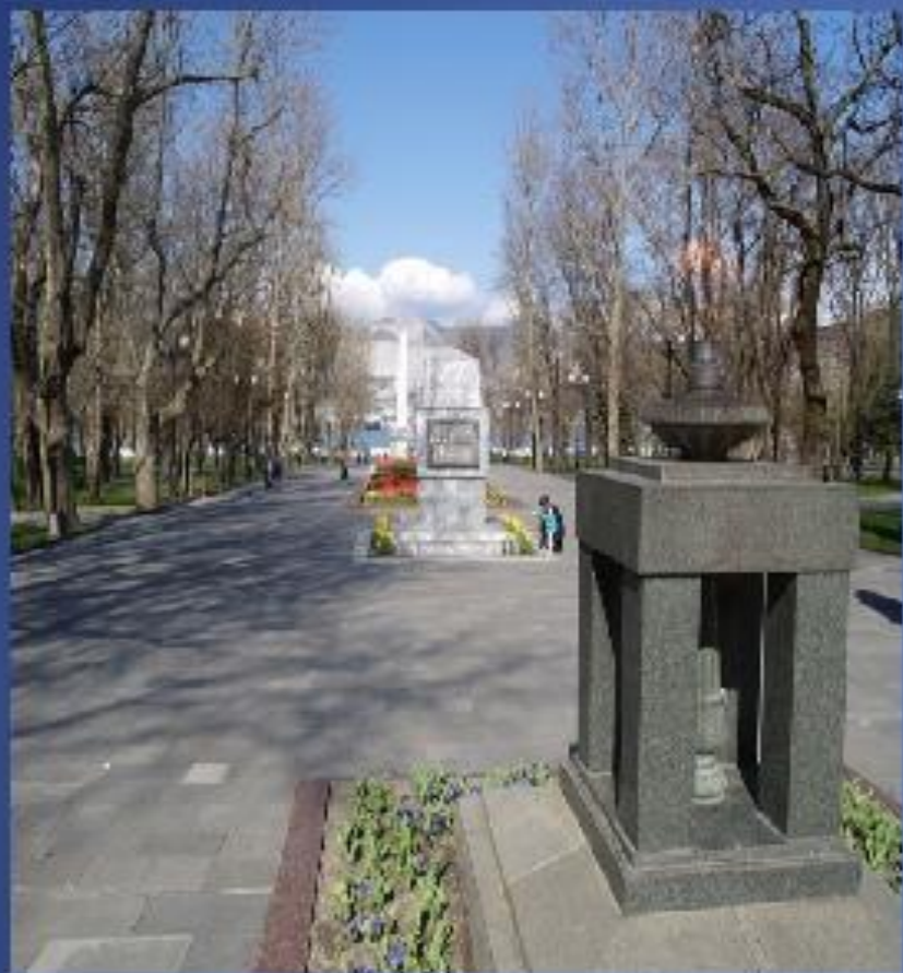
Вечный огонь на площади героев