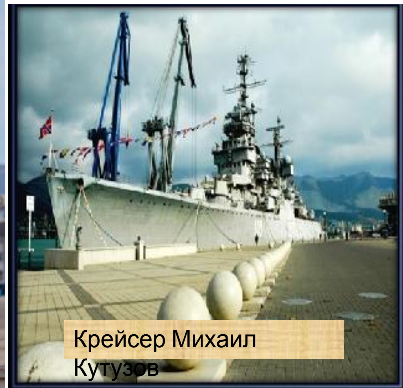
Крейсер Михаил Кутзов