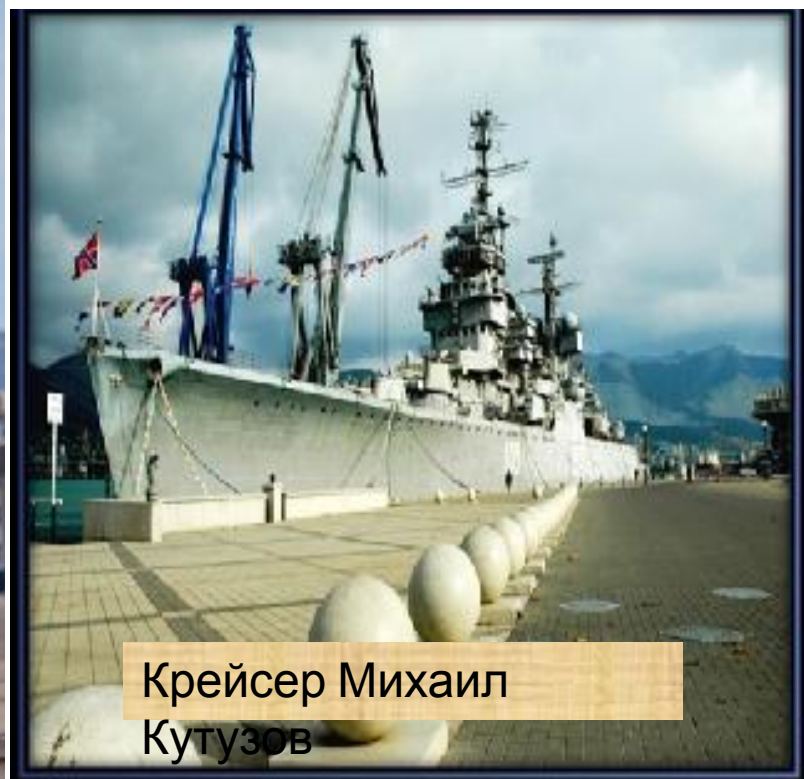
Крейсер Михаил Кутузов