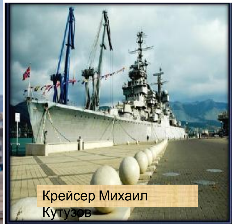
Крейсер Михаил Кутузов