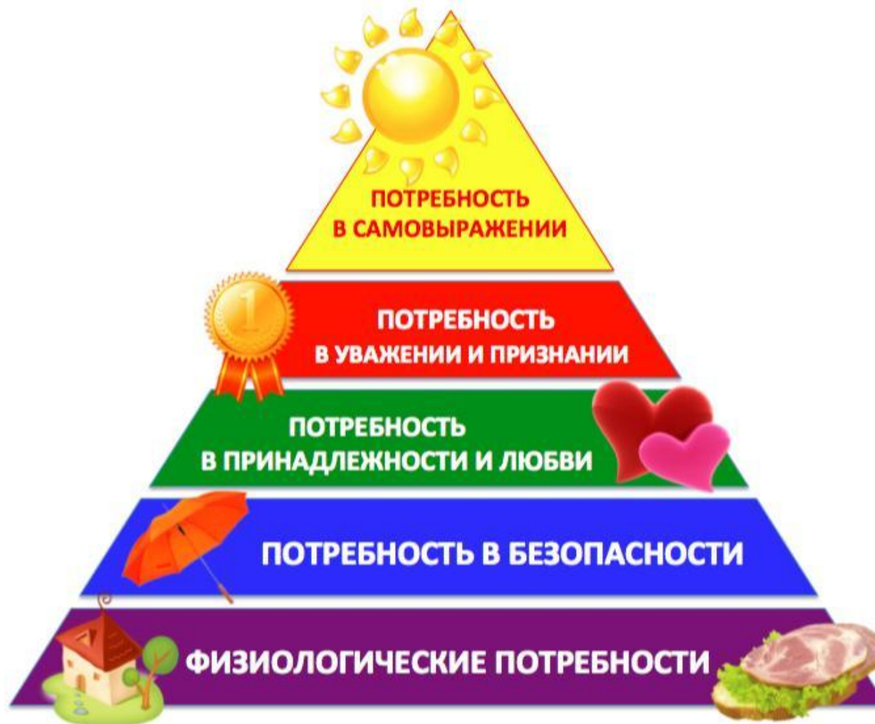
Пирамида А. Маслоу