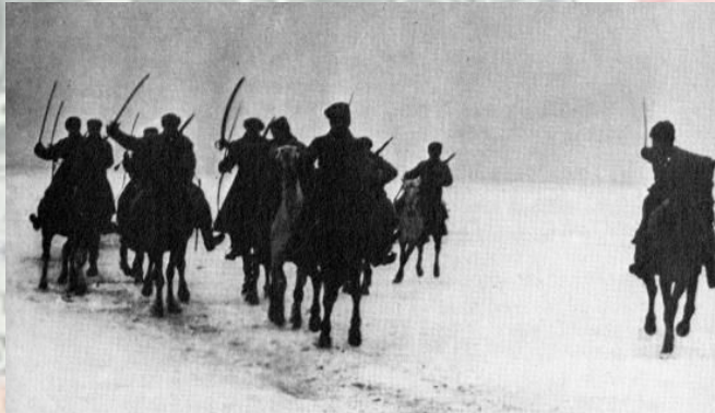
Мятеж Н.Махно На Южной Украине 1920-1921 гг.

- Почему с особой жестокостью подавлено именно Кронштатское восстание