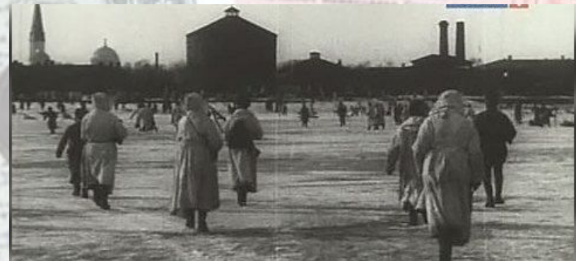
Восстание в Кронштадте