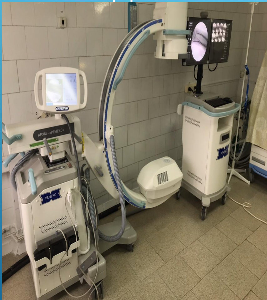
Система рентгеновская диагностическая портативная общего назначения