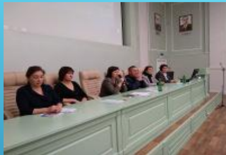
Встреча со студентами и ординаторами высших учебных заведений