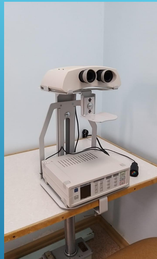
Аппарат ИК лазерный для коррекции нарушений зрения