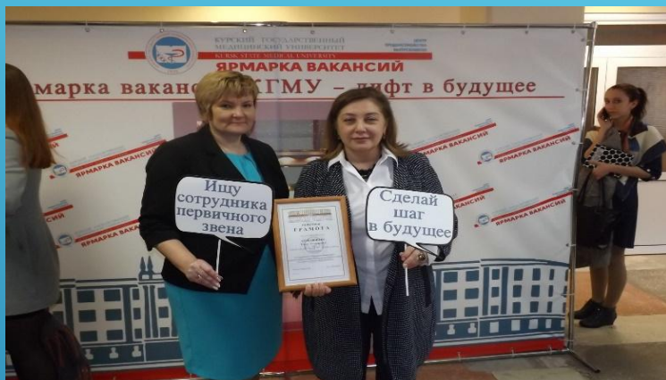
Участие в Ярмарке вакансий КГМУ