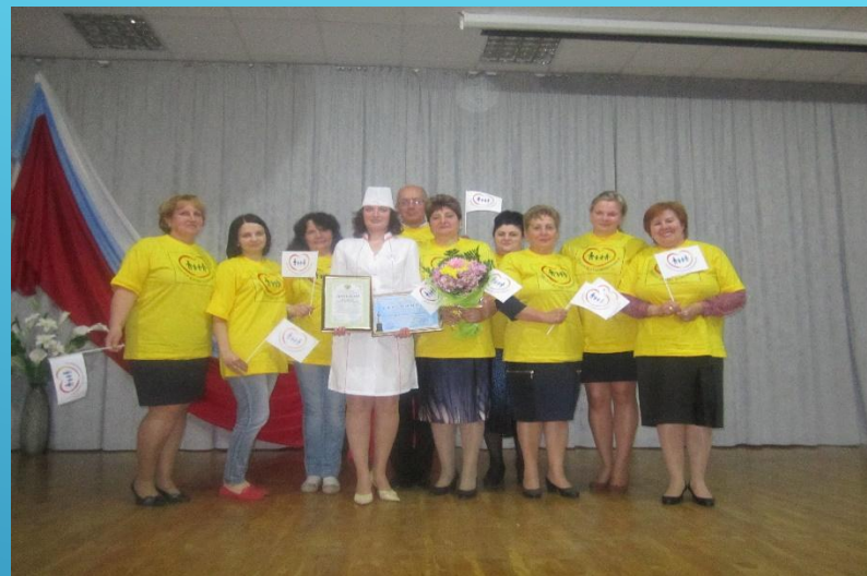
Участие в конкурсе «Лучший по профессии»