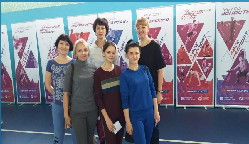
Спартакиада медицинских работников