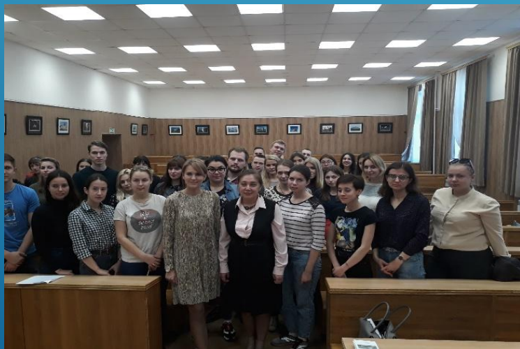
Встреча со студентами и ординаторами КГМУ