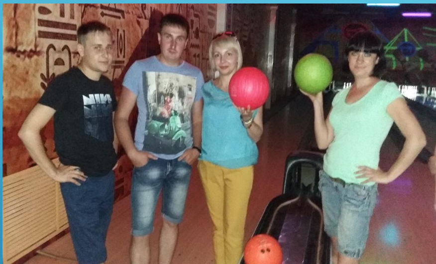
Турнир по боулингу