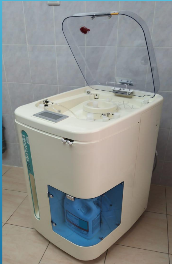
Моечно- дезинфицирующий автоматический репроцессор для гибких эндоскопов