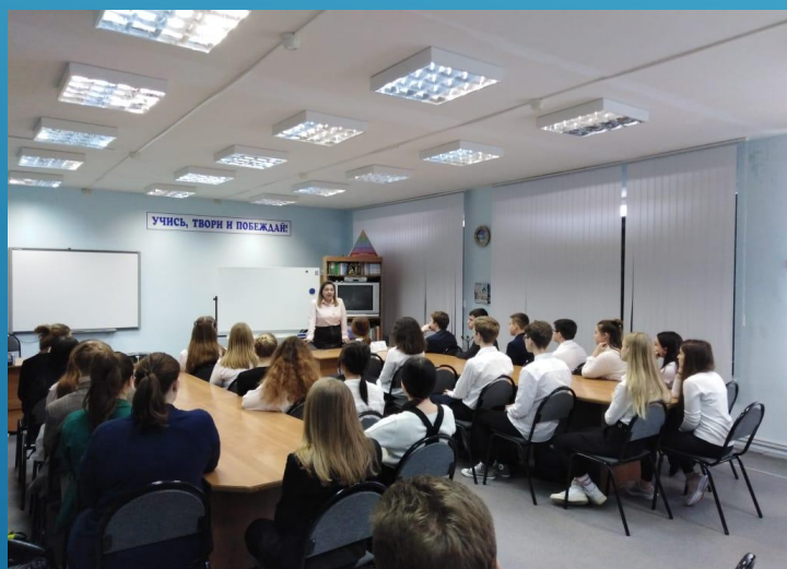
Беседа с выпускниками МАОУ «СОШ № 40»