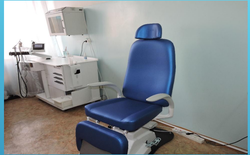
Система для ЛОР осмотра