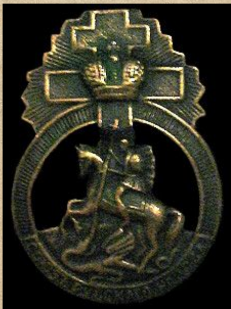
Значок одесского отделения Союза русского народа