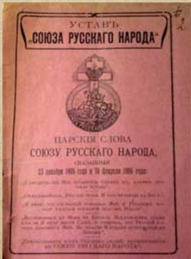
Устав «Союза русского народа», 1906