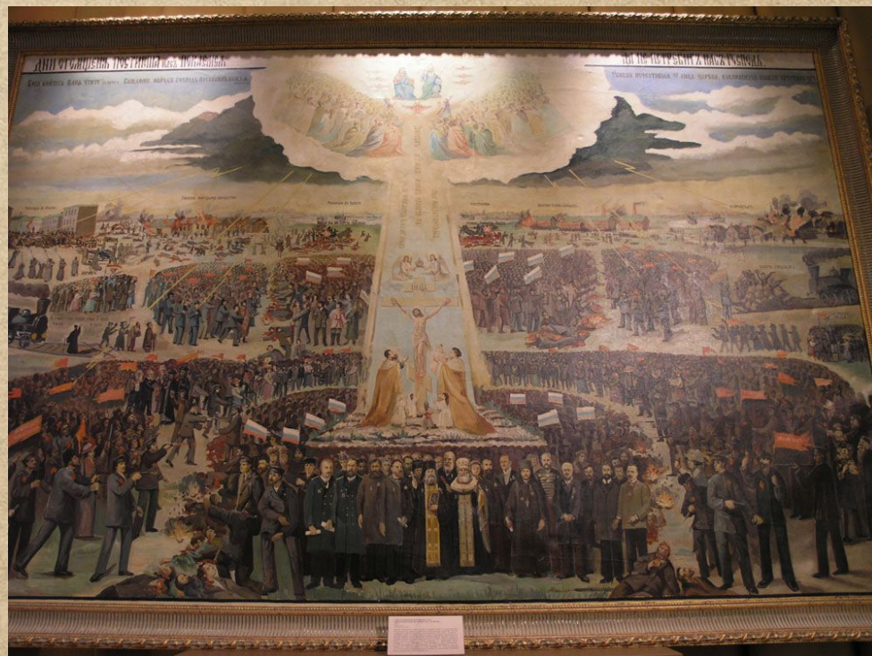
1905? 1906? 1907? художник неизвестен. Предположительно А,А, Майков