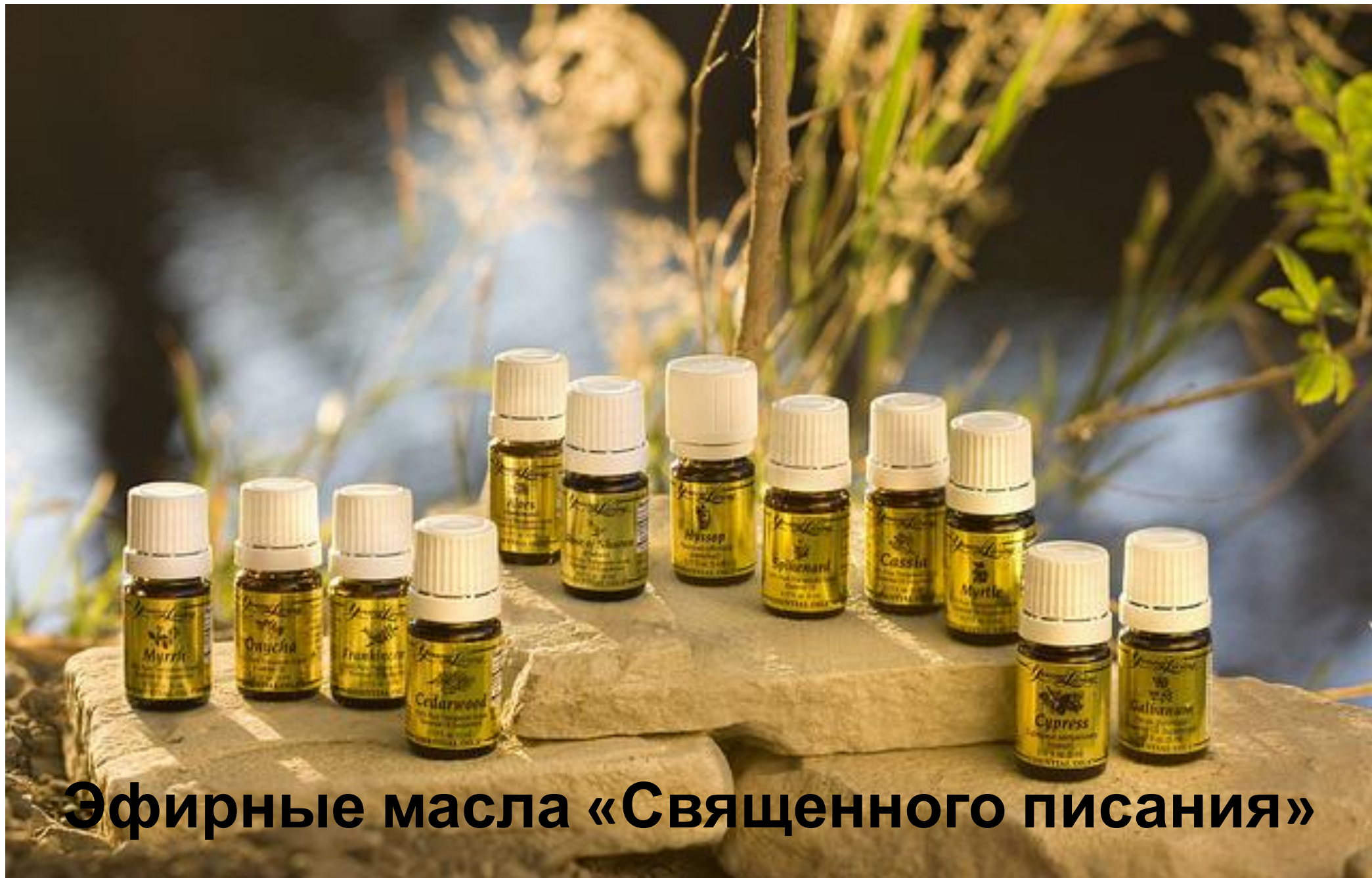
Эфирные масла «Священного писания»