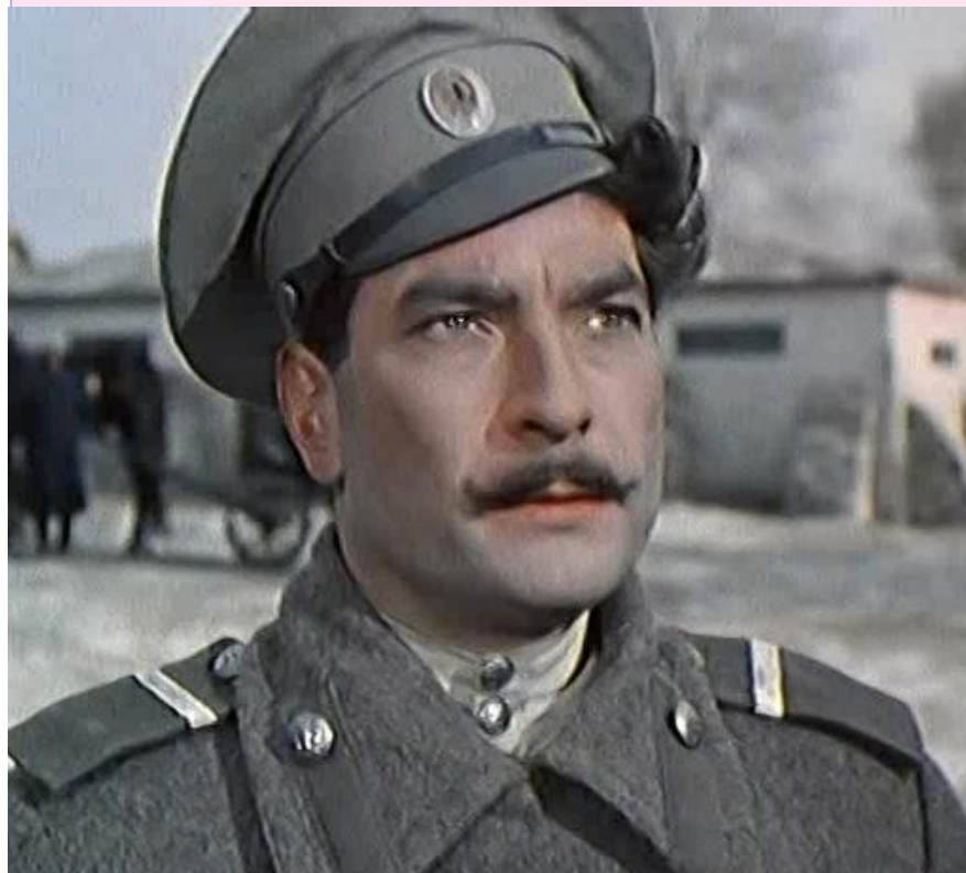
Петр Глебов в роли Григория Мелехова из к/ф "Тихий дон» (1957г.)

Григорий — простой и малограмотный казак, но характер его сложен и многогранен. Автор наделяет его лучшими чертами, присущими народу.