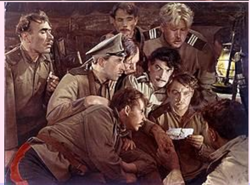
Кадры из к/ф "Тихий дон» (1957г.)