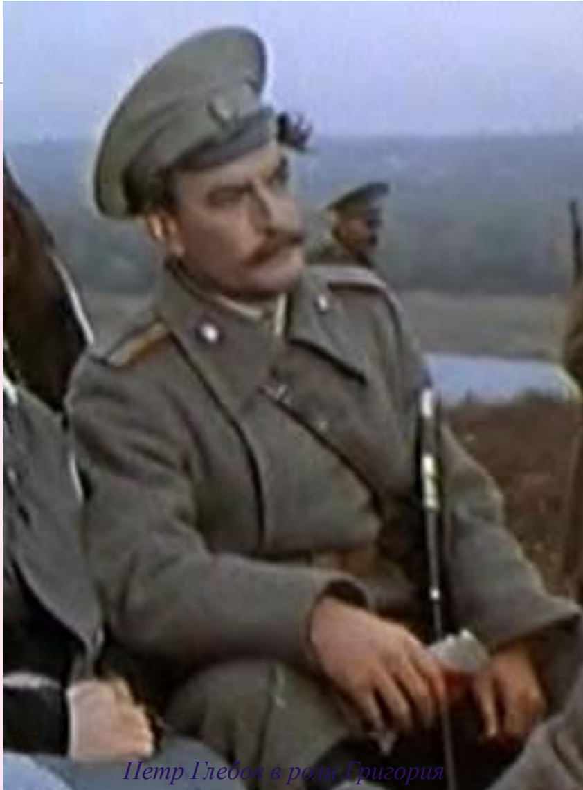
Петр Глебов в роли Григория Мелехова из к/ф "Тихий дон» (1957г.)

Во время революции поиски правды Григорием продолжаются. После спора с Котляровым и Кошевым, где герой заявляет, что пропаганда равенства – лишь приманка, чтобы ловить невежественный народ , Григорий приходит к выводу, что глупо искать единую всеобщую правду. У разных людей – своя разная правда в зависимости от их устремлений.