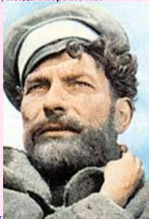
Портрет Петра Мелехова в роли Григория Мелехова из к/ф "Тихий дон" (1957г.)

Уже портретная характеристика, соотнесенная с только что поведанной историей его деда Прокофия, создает впечатление о человеке ярком, по-юношески порывистом и неукротимом.