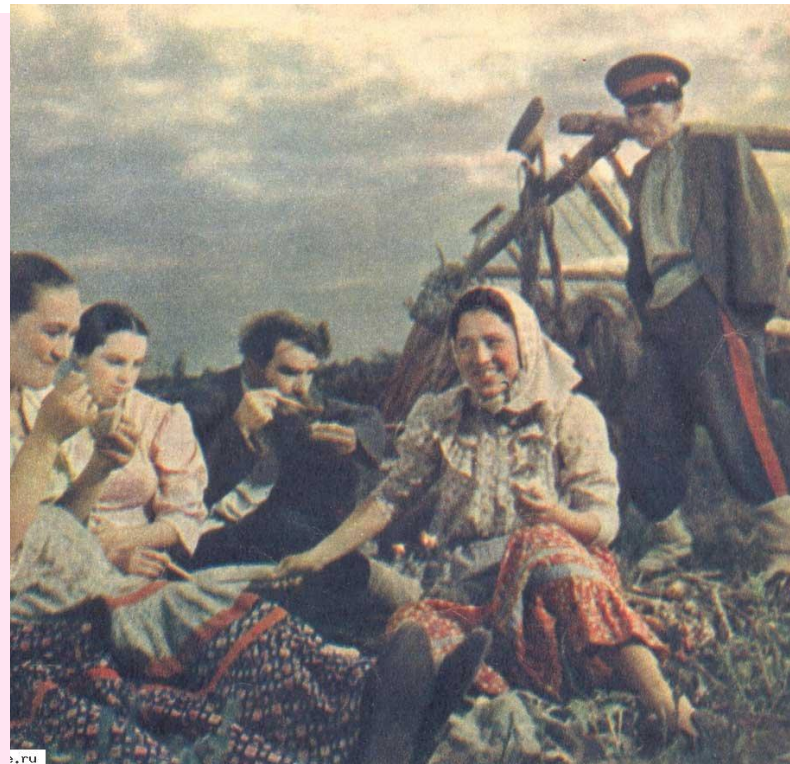
Кадр из к/ф "Тихий дон» (1957г.)

«Хорошо бы взяться руками за чапиги и пойти по влажной борозде за плугом, жадно вбирая ноздрями сырой и пресный запах взрыхленной земли, горький аромат порезанной лемехом травы».