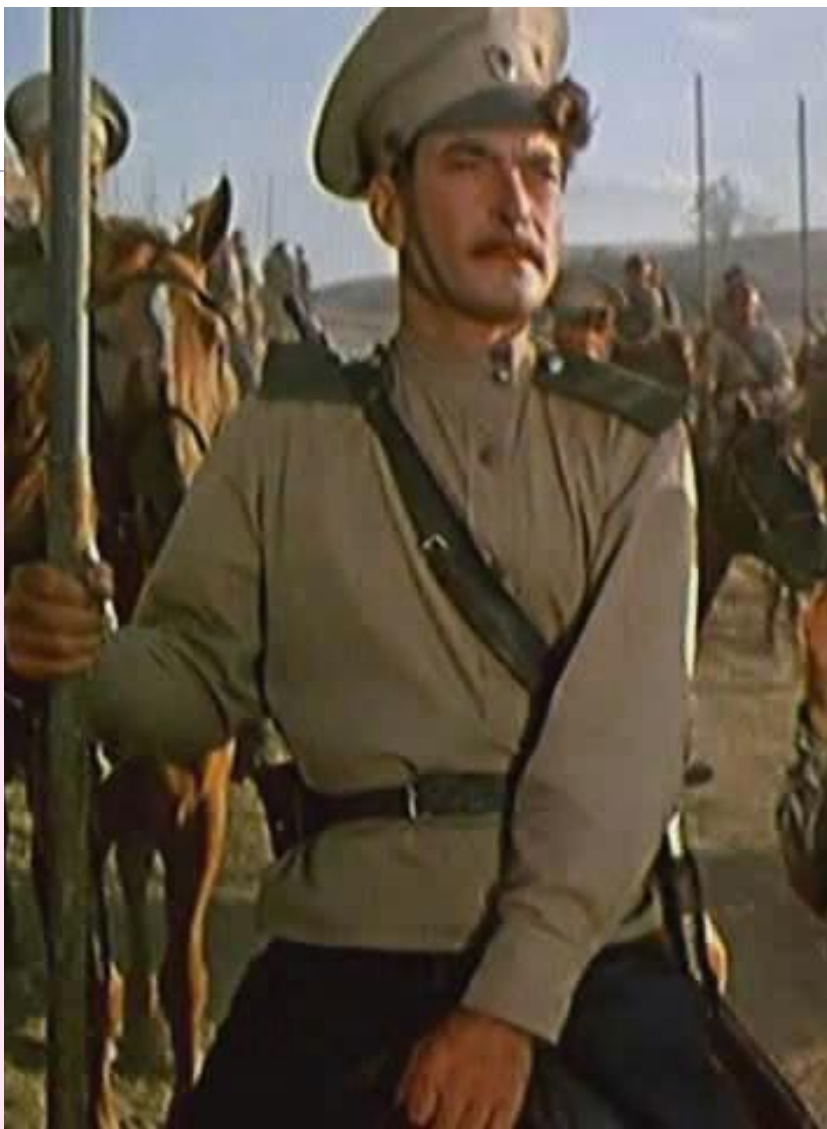
Петр Глебов в роли Григория Мелехова из к/ф "Тихий дон» (1957г.)

Война заставляет Григория по-новому посмотреть на проблемы долга и справедливости, искать правду и не находить ее ни в одном из враждующих лагерей.