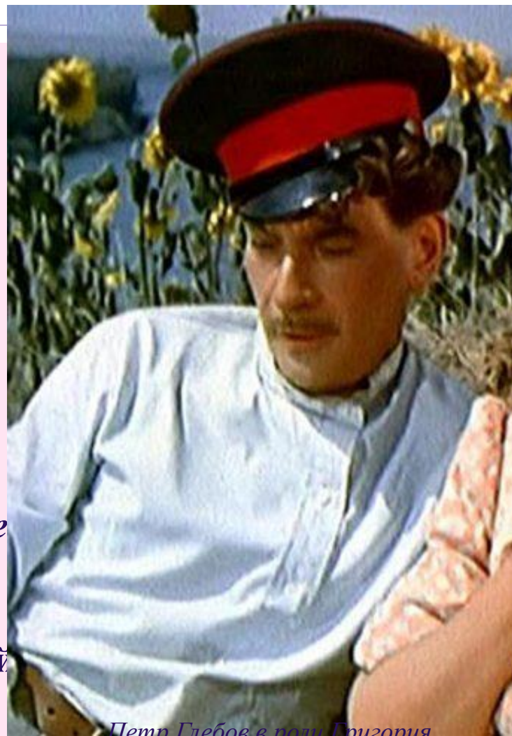
Петр Глебов в роли Григория Мелехова из к/ф "Тихий дон" (1957г.)

Из этих черт и складывается тот душевный дар, которым наделен Григорий, - его человечность.