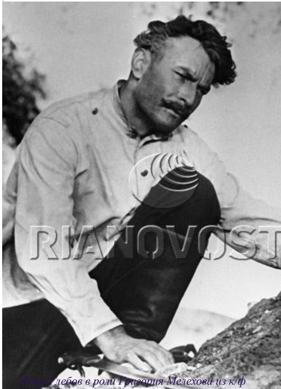
Петр Глебов в роли Григория Мелехова из к/ф "Тихий дон» (1957г.)

Григорий - настоящий, типичный казак, бедовый и честный, каких становится все меньше.