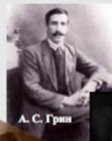
А. С. Грин