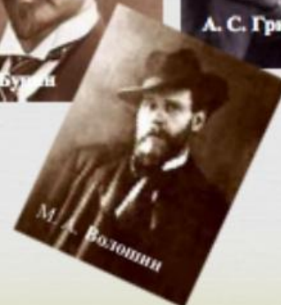
М. А. Волошин