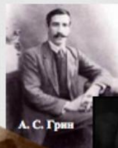
А. С. Грин