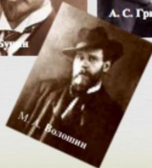
М. А. Волошин