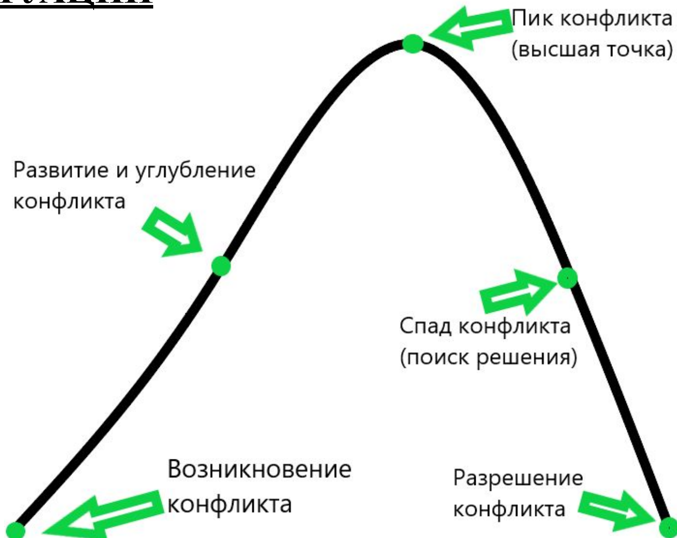
ГРАФИК РАЗВИТИЯ КОНФЛИКТНОЙ СИТУАЦИИ