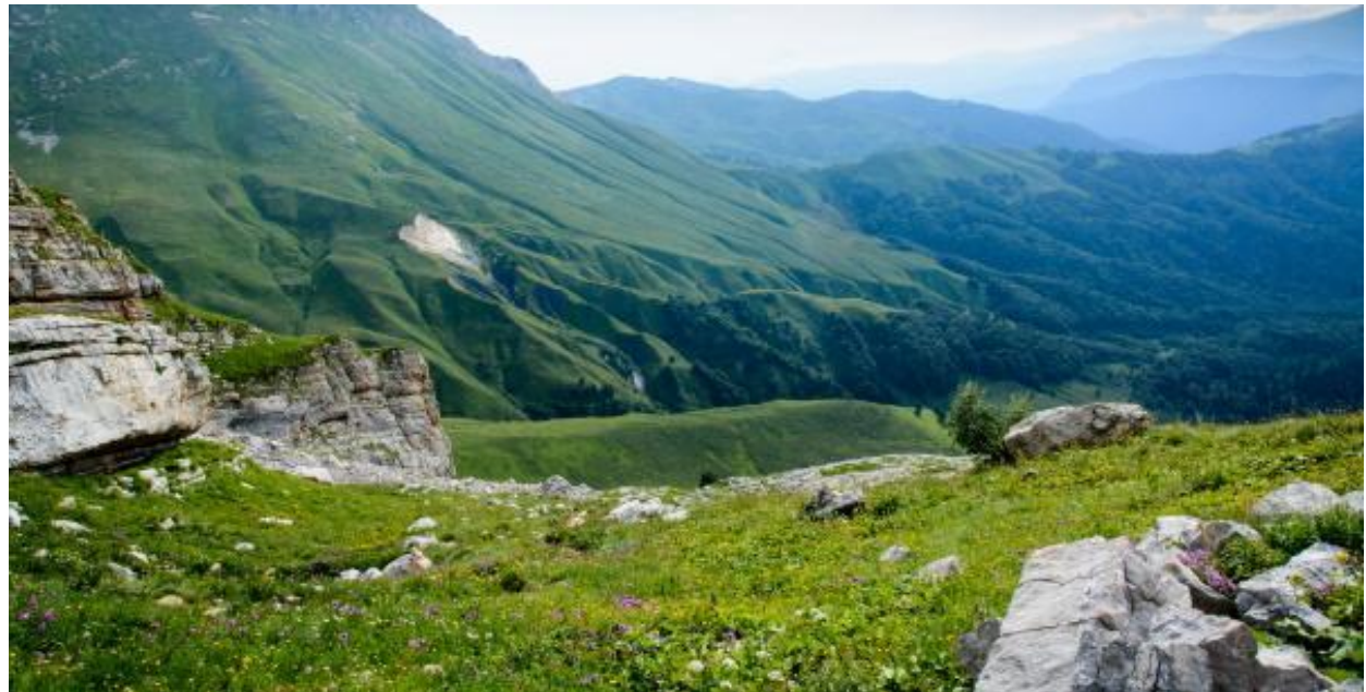
Кавказский биосферный заповедник